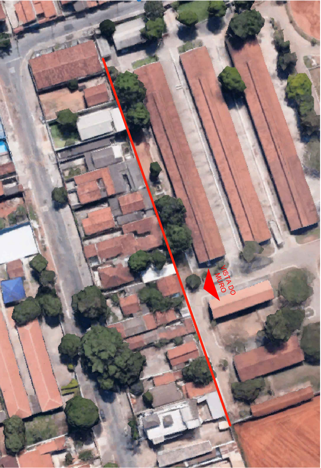
6 MURO A SER DEMOLIDO ESCALA