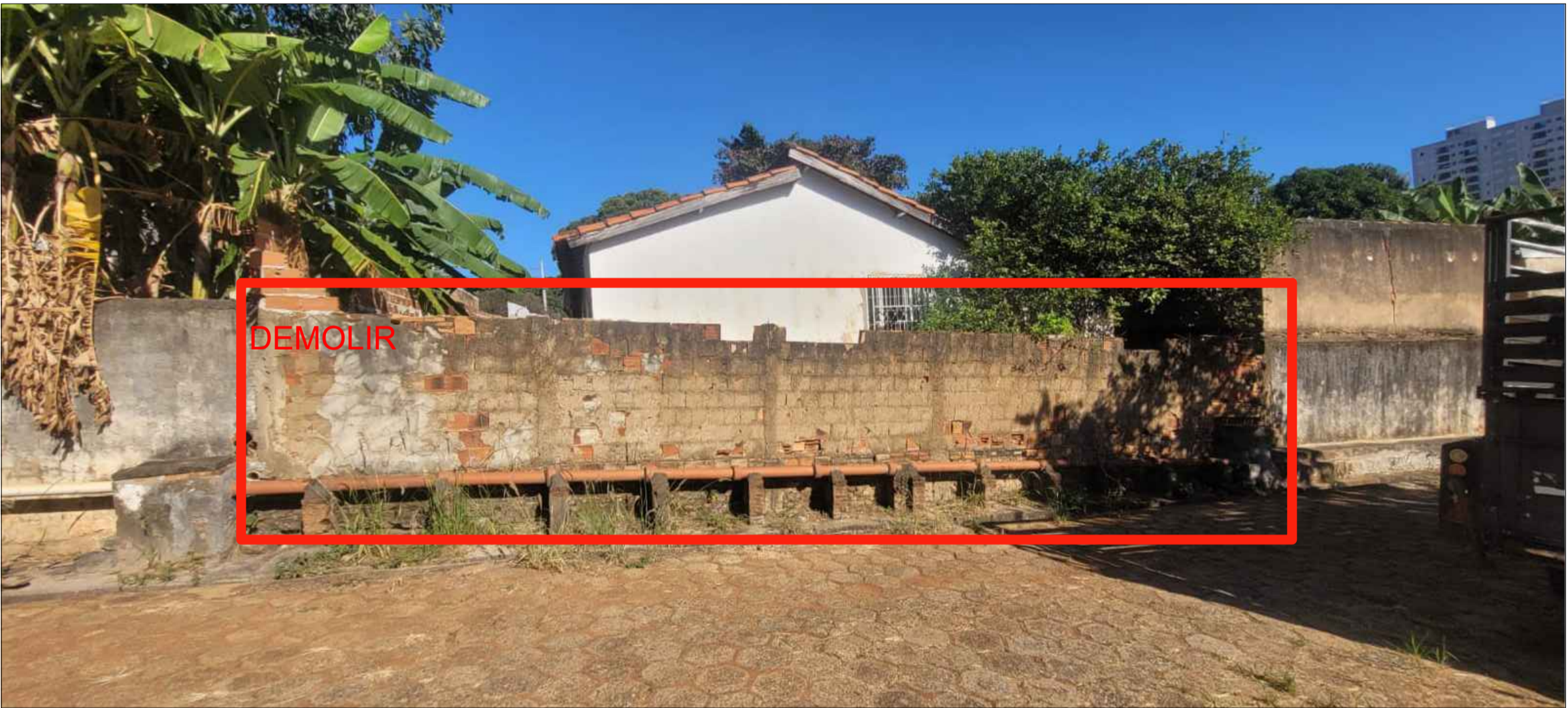
3 MURO A SER DEMOLIDO ESCALA