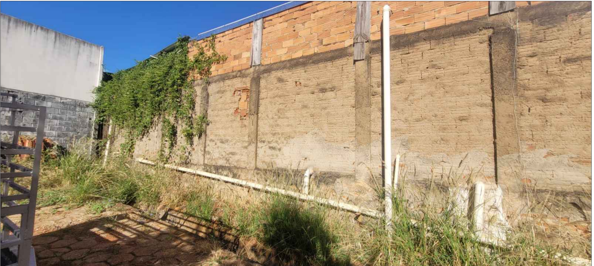
4 RELVA A SER EXTIRPADA ESCALA