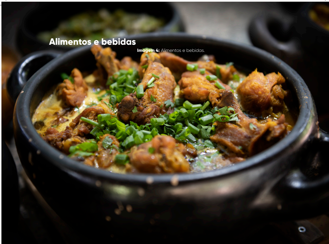
Imagem 4: Alimentos e bebidas.