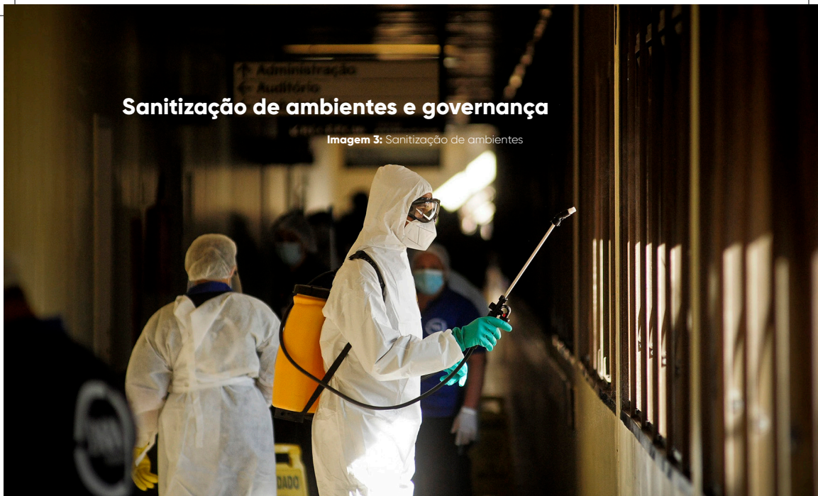
Imagem 3: Sanitização de ambientes