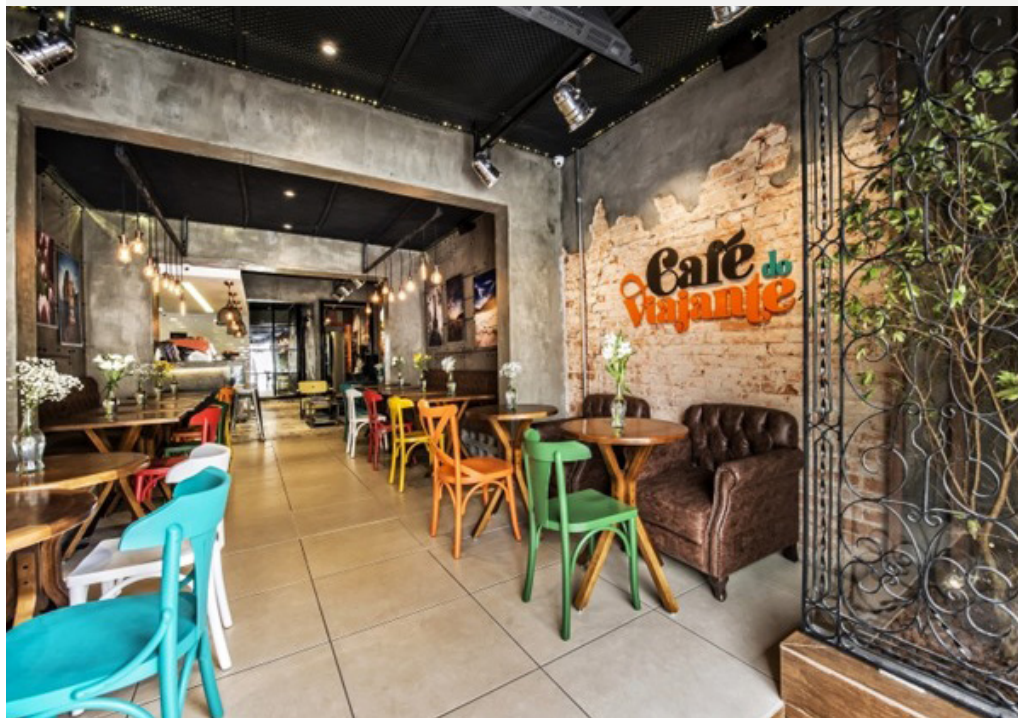
Imagem 5: Restaurante

Bares, Restaurantes e Cafeterias também tem um protocolo específico, visto que estão diretamente relacionados ao turismo: