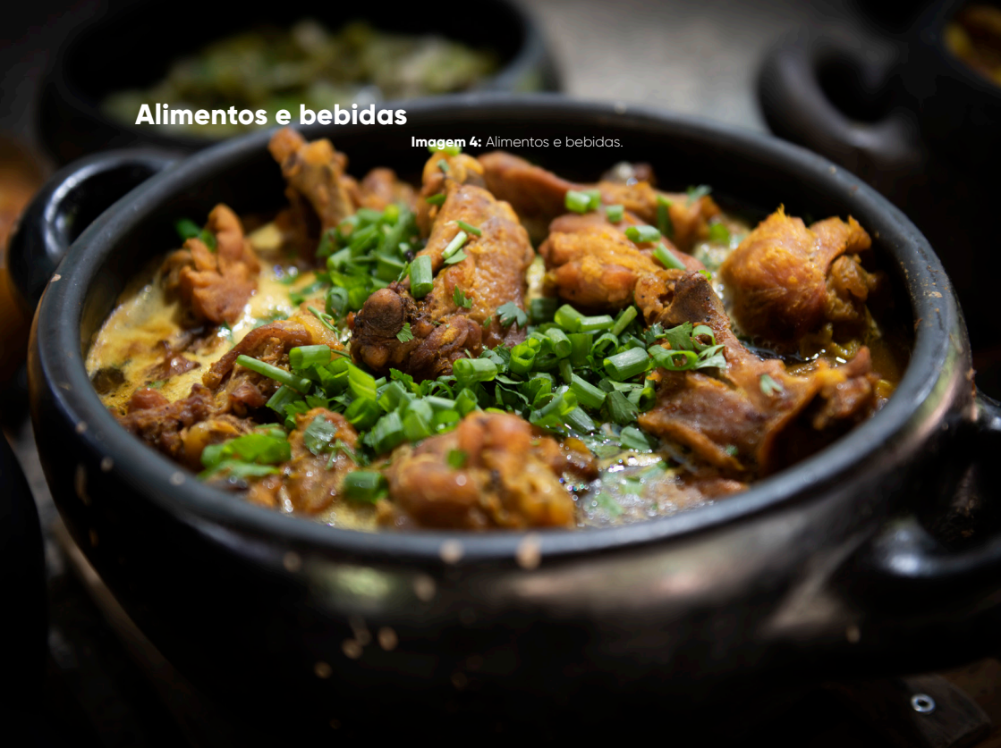
Imagem 4: Alimentos e bebidas.