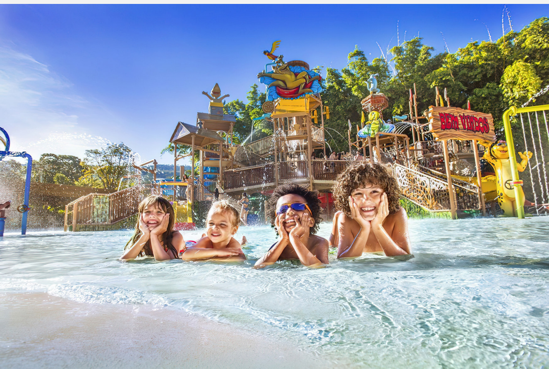
Imagem 7: Parques temáticos aquáticos

Segundo o CDC – Center of Disease Control and Preventions, órgão dos Estados Unidos, não há evidências de que o vírus que causa a COVID-19 possa ser transmitido às pessoas através da água em piscinas, banheiras de hidromassagem, spas ou áreas de recreação aquática.