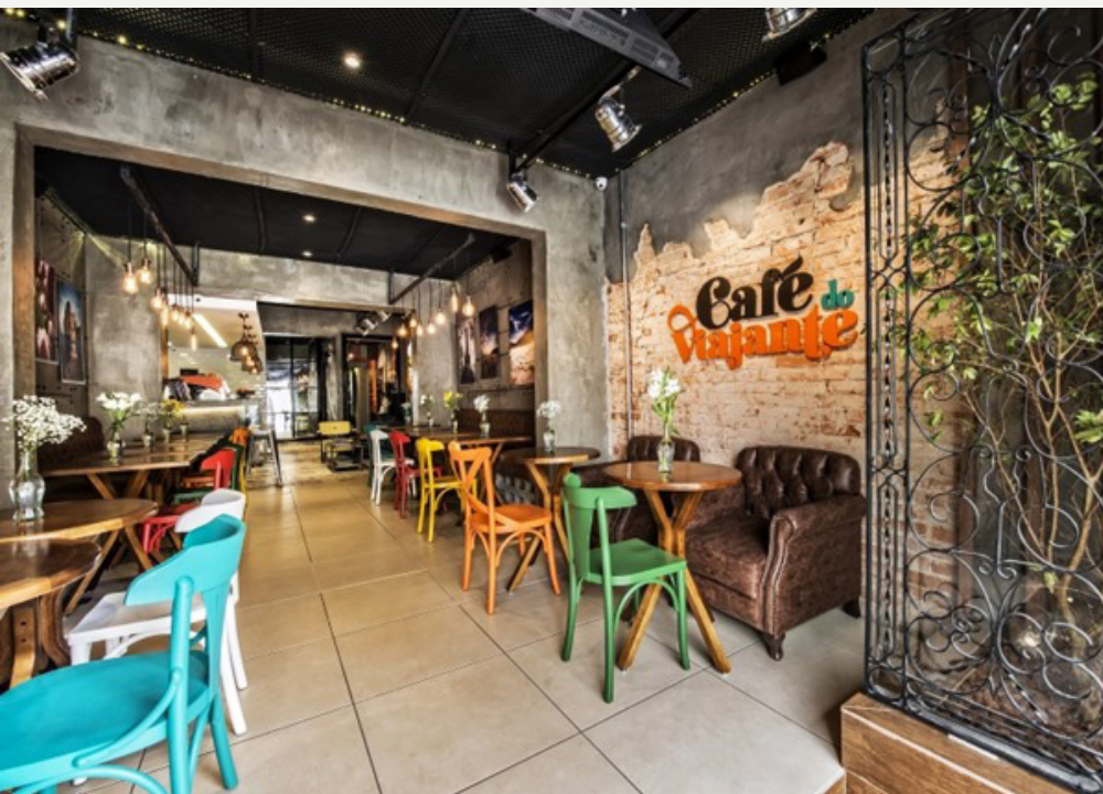
Imagem 5: Restaurante

Bares, Restaurantes e Cafeterias também tem um protocolo específico, visto que estão diretamente relacionados ao turismo: