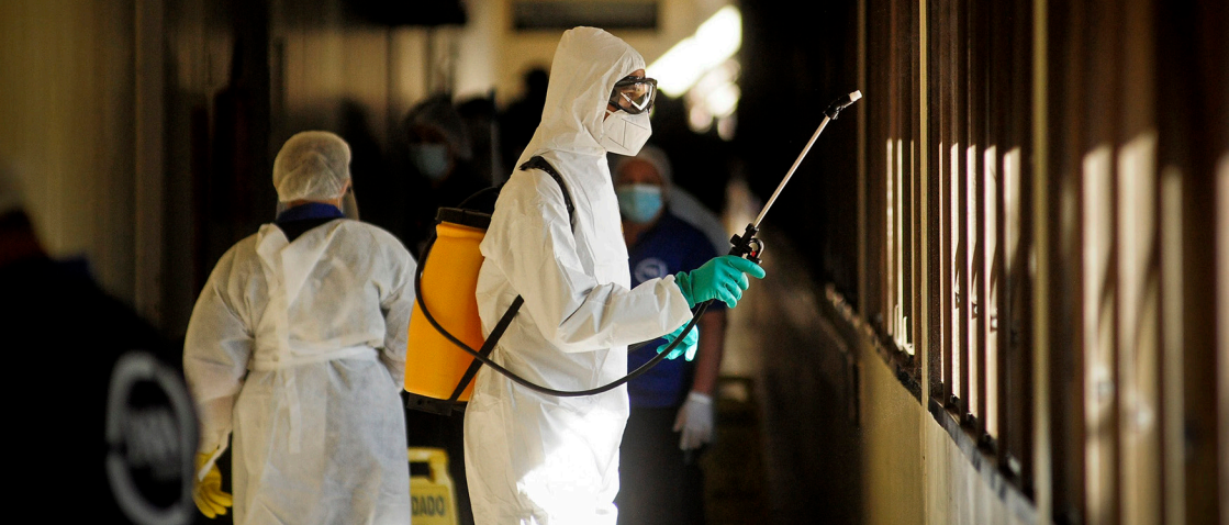
Imagem 3: Sanitização de ambientes