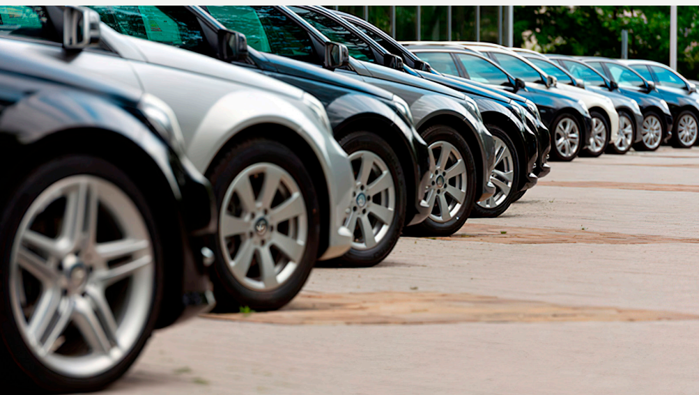
Imagem 8: Locadora de Veículos