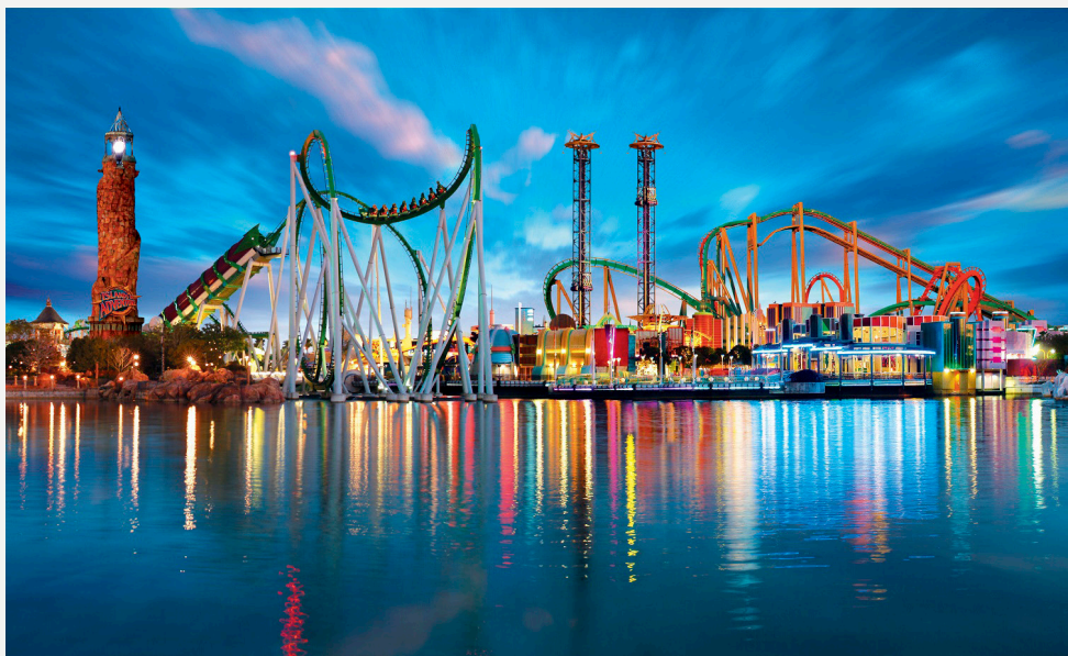
Imagem 6: Parques Temáticos

O protocolo para parques temáticos é um dos mais extensos do Selo, uma vez que engloba regras de distanciamento social, higiene pessoal, desinfecção de ambientes, comunicação e monitoramento. Nesse sentido, os principais pontos relativos aos parques temáticos são: