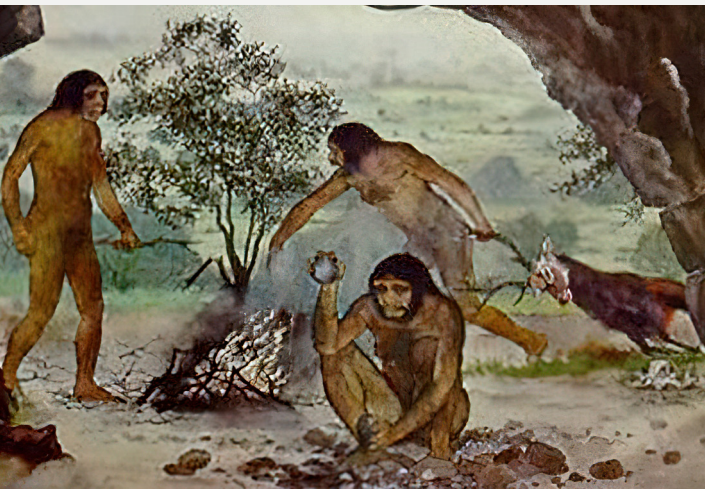
Imagem 2: Domínio do fogo.