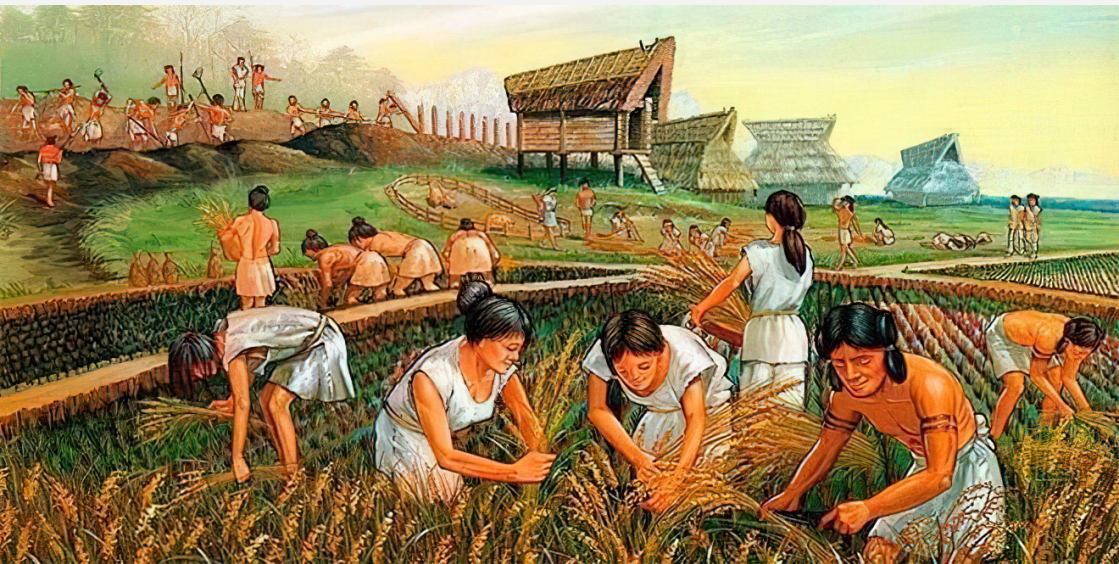
Imagem 4: Desenvolvimento da agricultura