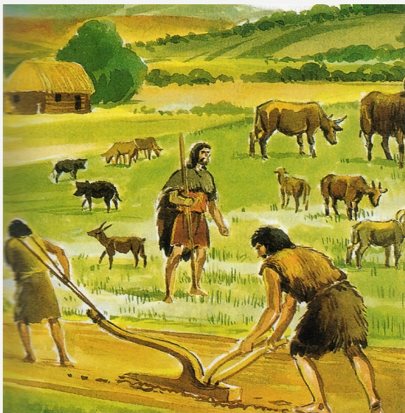
Imagem 3: Domesticação dos animais

O quarto estágio é representado com o surgimento de fato da agricultura. Além da observação dos ciclos naturais de reprodução dos vegetais, o homem foi capaz de desenvolver ecossistemas artificiais para a produção contínua, suprimindo suas necessidades alimentares. Sob esta condição, a segurança e saúde do ser humano se desenvolveu de tal modo que permitiu o aumento da perspectiva de vida, aumento da reprodução humana e maiores chances de sobrevivência, o que aumentou o contingente de pessoas no mundo (Imagem 4).