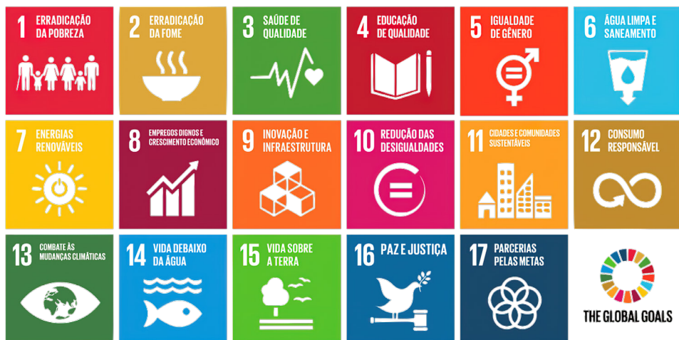
Imagem 5: Medidas para implantação de um programa de desenvolvimento sustentável.