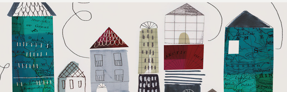
Imagem 3: Dilemas da Hospitalidade