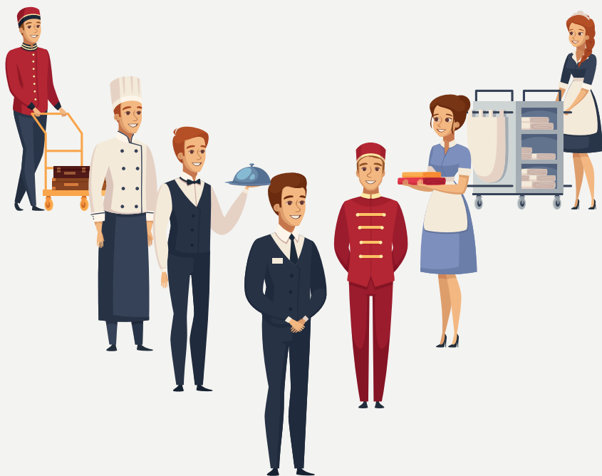
Imagem 2: Hospitalidade

A hospitalidade trabalha essa relação entre o local receptivo e aquele que o procura. Partindo desse pressuposto percebemos que a necessidade de abrigo e de abrigar alguém é uma necessidade que possuímos até hoje. Entende-se que hospitalidade é a maneira de se receber uma pessoa fazendo com que está se sinta integrada ao ambiente, se sinta acolhida. Quando damos abrigo a uma pessoa em nossa casa, estamos sendo hospitaleiros tratando da melhor maneira possível, isto pode ocorrer ao recebermos um hóspede em nossa casa, com uma pessoa que está começando a trabalhar em nosso ambiente de trabalho, quando fazemos que essa pessoa se sinta acolhida entre outros. Nesses casos isto ocorre de uma forma espontânea.