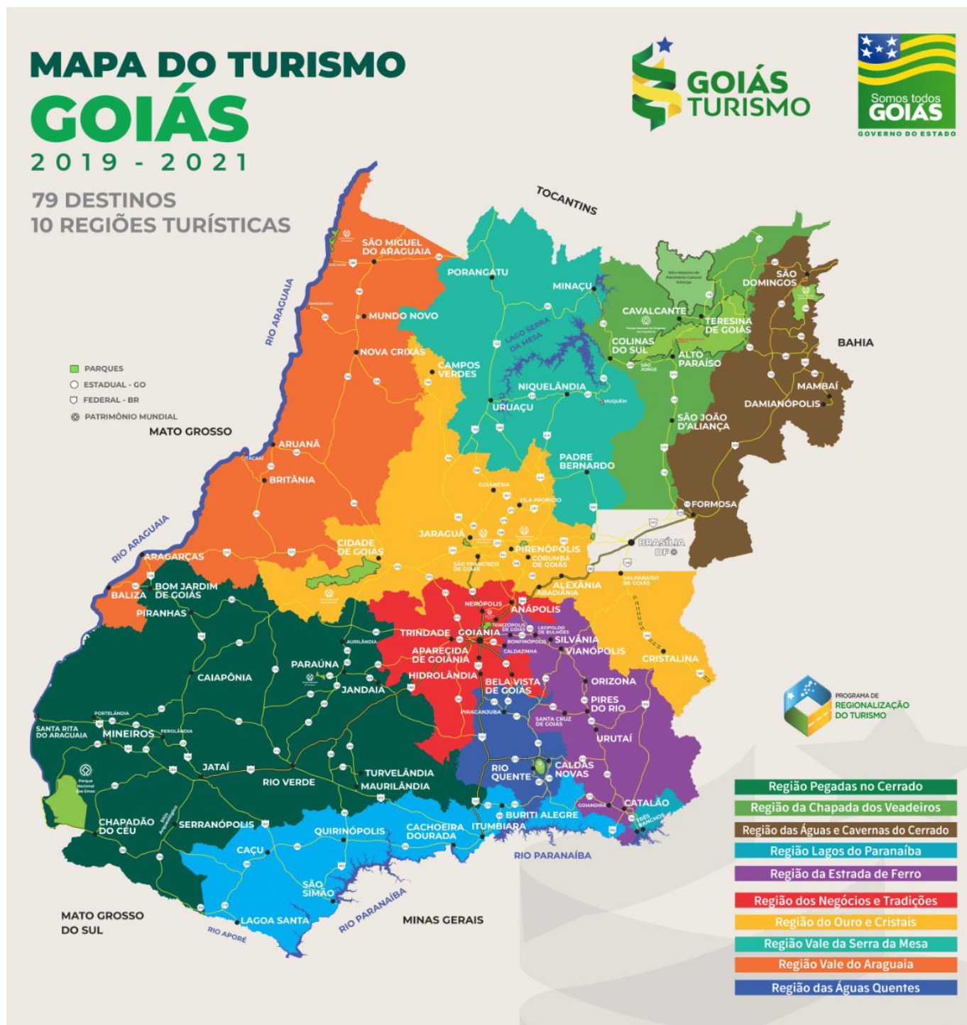
Figura 2: Mapa Turístico Oficial do Estado de Goiás.

mento de políticas públicas regionalizadas e descentralizadas. Urutaí é um dos 79 municípios do estado que compõem atualmente o Mapa Turístico Oficial e compõe a Região da Estrada de Ferro, conforme o mapa a seguir: