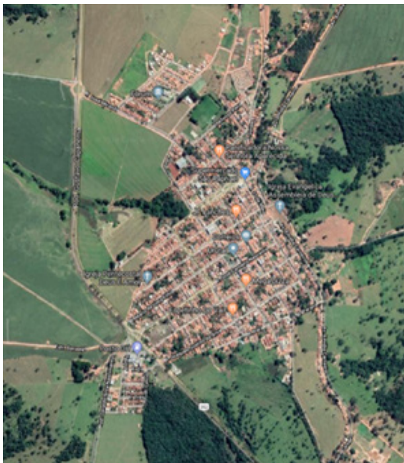
Figura 4: Área Urbana do Município de Urutaí