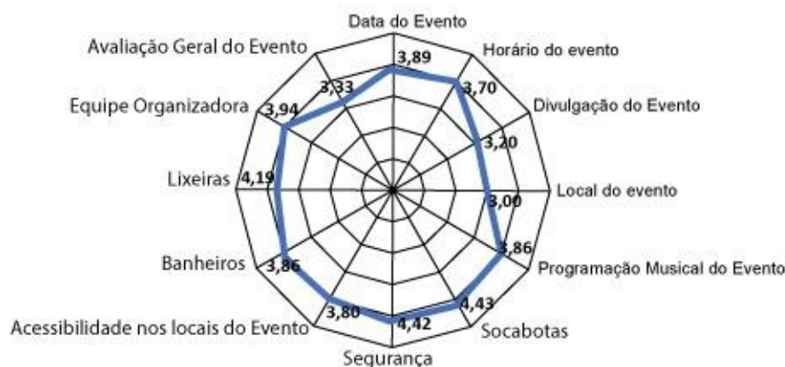
Gráfico 2: Avaliação do Planejamento e Organização do Carnaval em Três Ranchos no ano de 2020.

Obs. As notas da avaliação variam entre 1 e 5, sendo: (1) Péssimo, (2) Ruim, (3) Razoável, (4) Bom e (5) Ótimo.