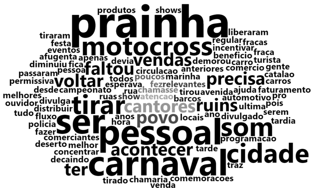
Tabela 7: Em uma frase ou palavra, para você ou seu negócio, o que significa a palavra Carnaval em Três Ranchos.