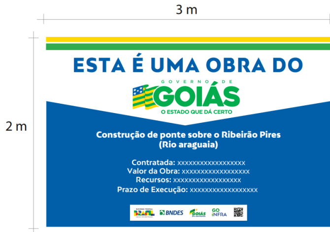
Foto 1 – Placa para identificação de Obras Civil.

Placa de obra da empresa em chapa de aço galvanizado de 1,00m x 1,5m. (Padrão CREA-GO-FISCALIZAÇÃO) – Foto 2.