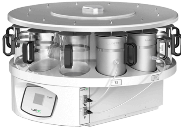
REFERÊNCIA PROCESSADOR DE TECIDOS IMAGEM MERAMENTE ILUSTRATIVA

5.1. A presente contratação de Fornecimento de Bens e Materiais - O objeto é a aquisição de equipamentos sendo 2 (dois) microscópios óptico do tipo trinocular utilizados para confecção de lâminas histológicas e análises microscópicas, 1 (um) micrótomo semi automático rotativo e 1 (um) processador automático de tecidos, respectivamente, para a elaboração de laudos complementares ao exame necroscópico realizados no Instituto Médico Legal Aristoclides Teixeira atendendo a demanda da capital e das demais Coordenações Regionais da Polícia Científica do Estado de Goiás. está fundamentada nos termos do [ETP - Estudo Técnico Preliminar].