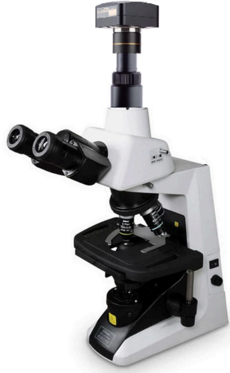
REFERÊNCIA MODELO DE MICROSCÓPIO IMAGEM MERAMENTE ILUSTRATIVA

MICRÓTOMO SEMI AUTOMÁTICO, ROTATIVO, COM AJUSTE DIGITAL, COM PAINEL DE CONTROLE, ESPESSURA DE CORTE DE 0 ATÉ 600 MICRÔMETROS, SISTEMA DE AVANÇO MOTORIZADO VOLANTE TRAVÉLVEL EM QUALQUER POSIÇÃO; SISTEMA PROTETOR DE SEGURANÇA PARA MANIPULAÇÃO DAS NAVALHAS, AUTORETRAÇÃO, ESPESSURA DE RETRAÇÃO DE 5 A 100 UM.