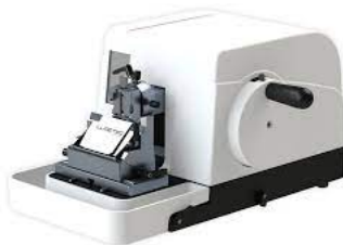
REFERÊNCIA MODELO DE MICRÓTOMO IMAGEM MERAMENTE ILUSTRATIVA