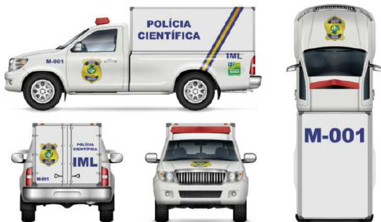
Viatura de Medicina Legal – Modelo Caminhonete / Picape.