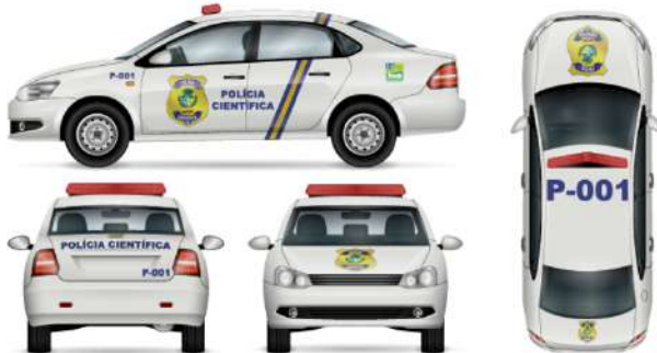
Viatura de Perícia Criminal – Modelo Sedan.