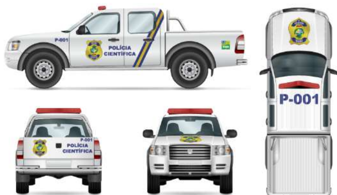
Viatura de Perícia Criminal – Modelo Caminhonete / Picape.