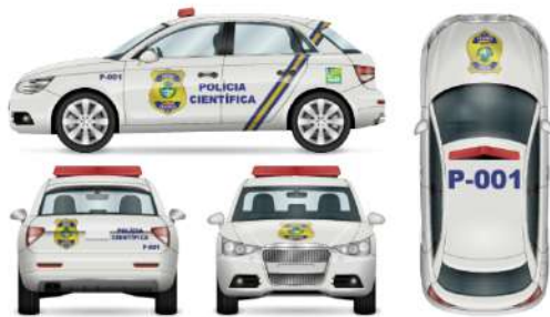
Viatura de Perícia Criminal – Modelo Hatch.

Todas as inscrições textuais deverão ser confeccionadas em fonte Arial Black na cor AZUL ROYAL (Pantone 19-3955 TCX Royal Blue ). A inscrição POLÍCIA CIENTÍFICA , aposta na lateral, deverá ter dimensões de 25 cm de altura por 64 cm de largura. A inscrição de identificação da viatura, tanto da traseira quanto da lateral, deverá ter comprimento de 25 cm. Por fim, a inscrição de identificação da viatura aposta no teto terá dimensões de modo a cobrir a quase totalidade da largura do teto, ficando a 10 cm de distância de ambas as bordas. A logomarca do Governo do Estado de Goiás deverá ser aposta sobre o para-lama traseiro, em ambos os lados, e apresentar altura de 25 cm.