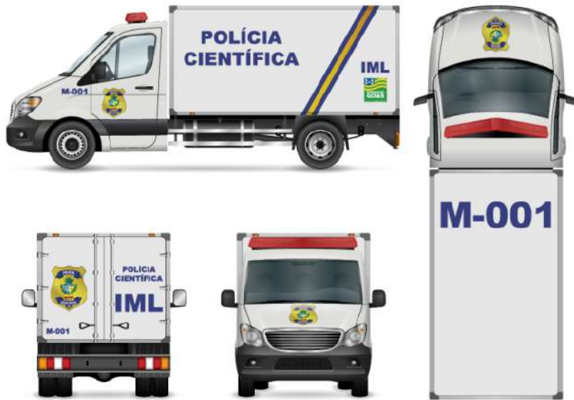
Viatura de Medicina Legal – Modelo Furgão.