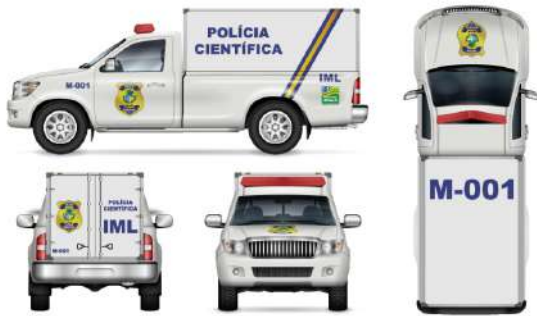
Viatura de Medicina Legal – Modelo Caminhonete / Picape.