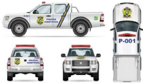
Viatura de Perícia Criminal – Modelo Caminhonete / Picape.