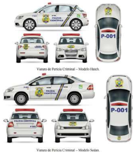
Viatura de Perícia Criminal - Modelo Sedan.

Todas as inscrições textuais deverão ser confeccionadas em fonte Arial Black na cor AZUL ROYAL (Pantone 19-3955 TCX Royal Blue). A inscrição POLÍCIA CIENTÍFICA, apostada na lateral, deverá ter dimensões de 25 cm de altura por 64 cm de largura. A inscrição de identificação da viatura, tanto da traseira quanto da lateral, deverá ter comprimento de 25 cm. Por fim, a inscrição de identificação da viatura apostada no teto terá dimensões de modo a cobrir a quase totalidade da largura do teto, ficando a 10 cm de distância de ambas as bordas. A logomarca do Governo do Estado de Goiás deverá ser apostada sobre o para-lama traseiro, em ambos os lados, e apresentar altura de 25 cm.