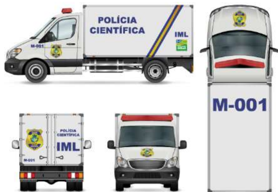
Viatura de Medicina Legal – Modelo Furgão.