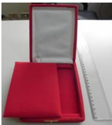
Figura 5: Estojo ( A cor deverá obedecer o Grau da Medalha)