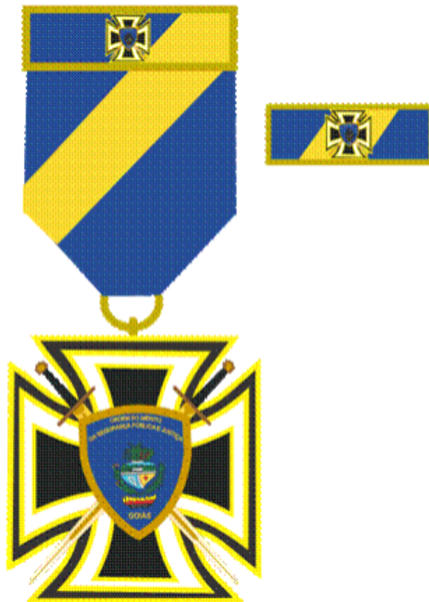
Figura 7: Botão de Lapela