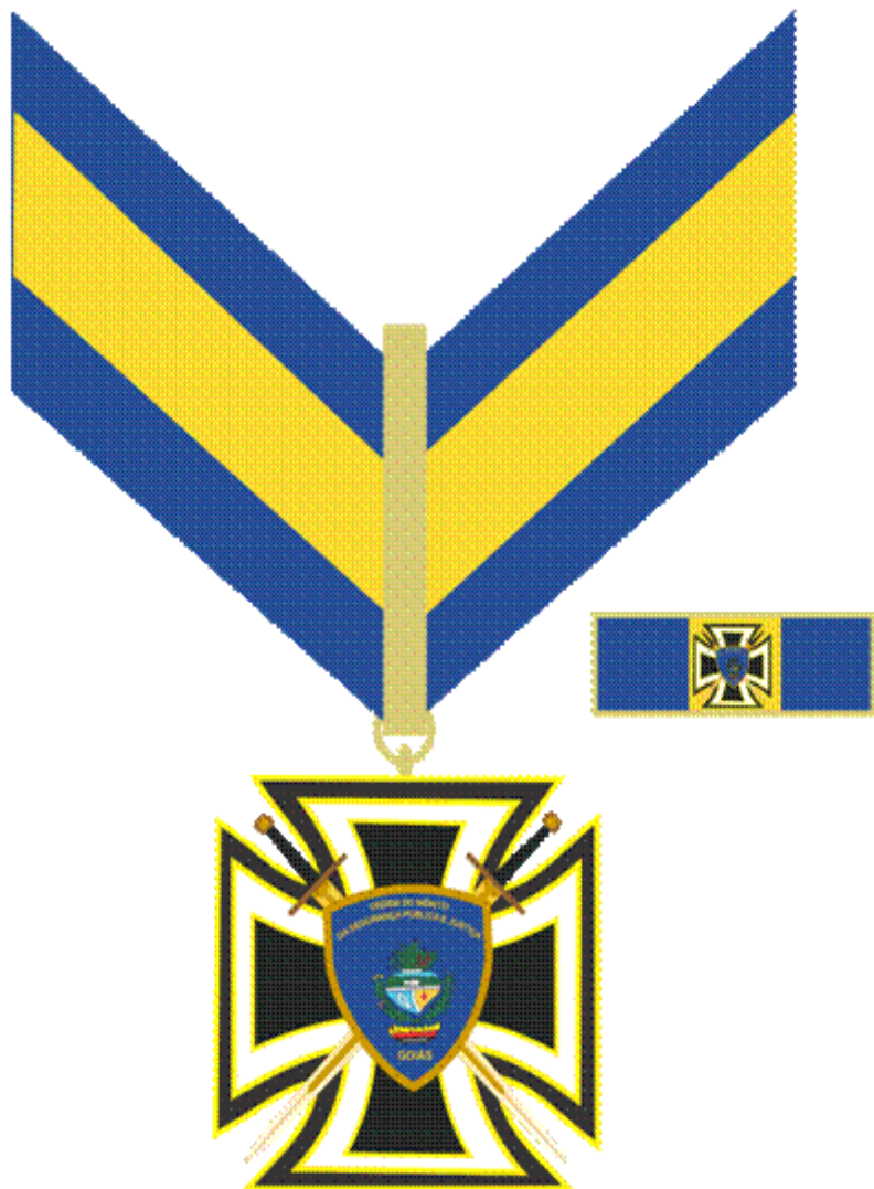
Figura 4: Medalha da Ordem do Mérito da Segurança Pública e Justiça de Goiás - Grau Grande-Oficial, com passador