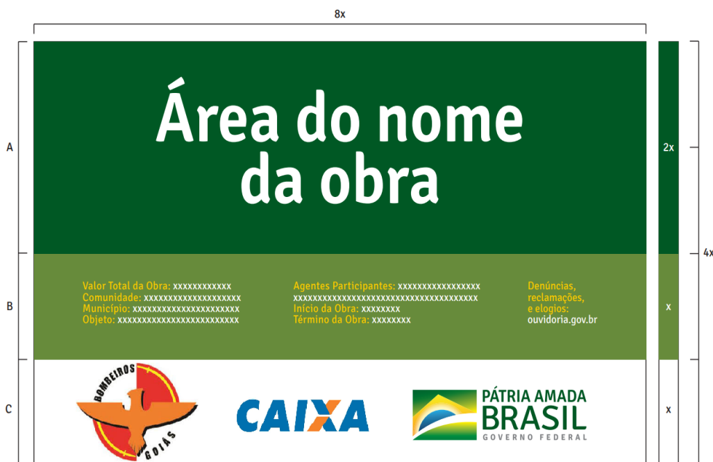
Figura 1 – Padrão de placa de obra do Governo Federal

A PLACA DA OBRA deve conter todos os participantes do processo, seguindo o modelo do “MANUAL_PLACAS_OBRAS GOV FEDERAL”, que poderá ser obtivo através do site da CAIXA ECONÔMICA FEDERAL com formato retangular na proporção 2 para 1. A placa deve conter área mínima de 3,125 m 2 , 1,25 m x 2,50 m. A placa deve ser em chapa galvanizada, pintada com dados da obra e colocada em vigotas de 6 x 12cm, a 2,20m da parte inferior da placa. Conforme modelo abaixo discriminado: