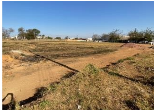
local a construir a delegacia de polícia