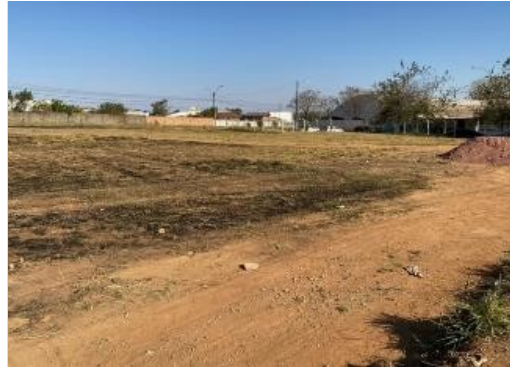
local a construir a delegacia de polícia Vista da rua Fernando Pessoa