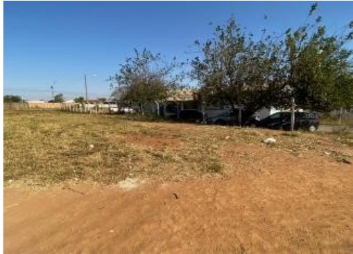
local a construir a delegacia de polícia Vista da rua Fernando Pessoa