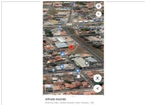
local a construir a delegacia de polícia