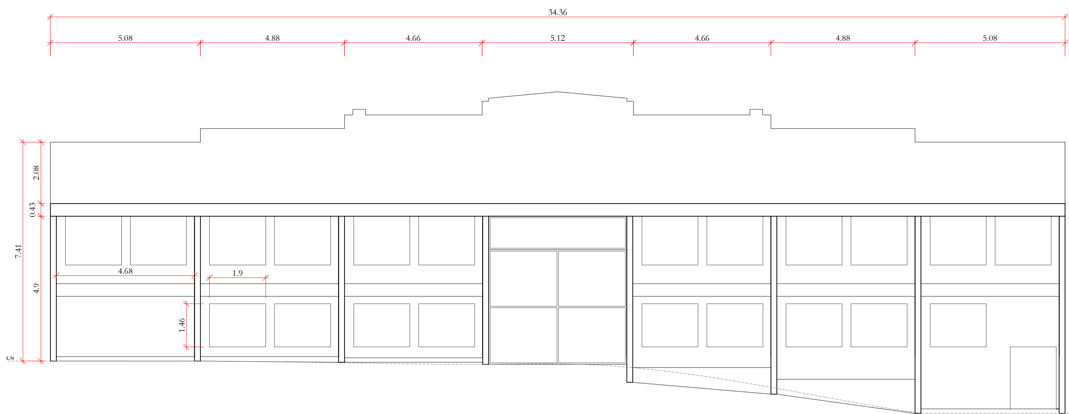
FACHADA PRICIPAL ATUAL ESC. 1:75