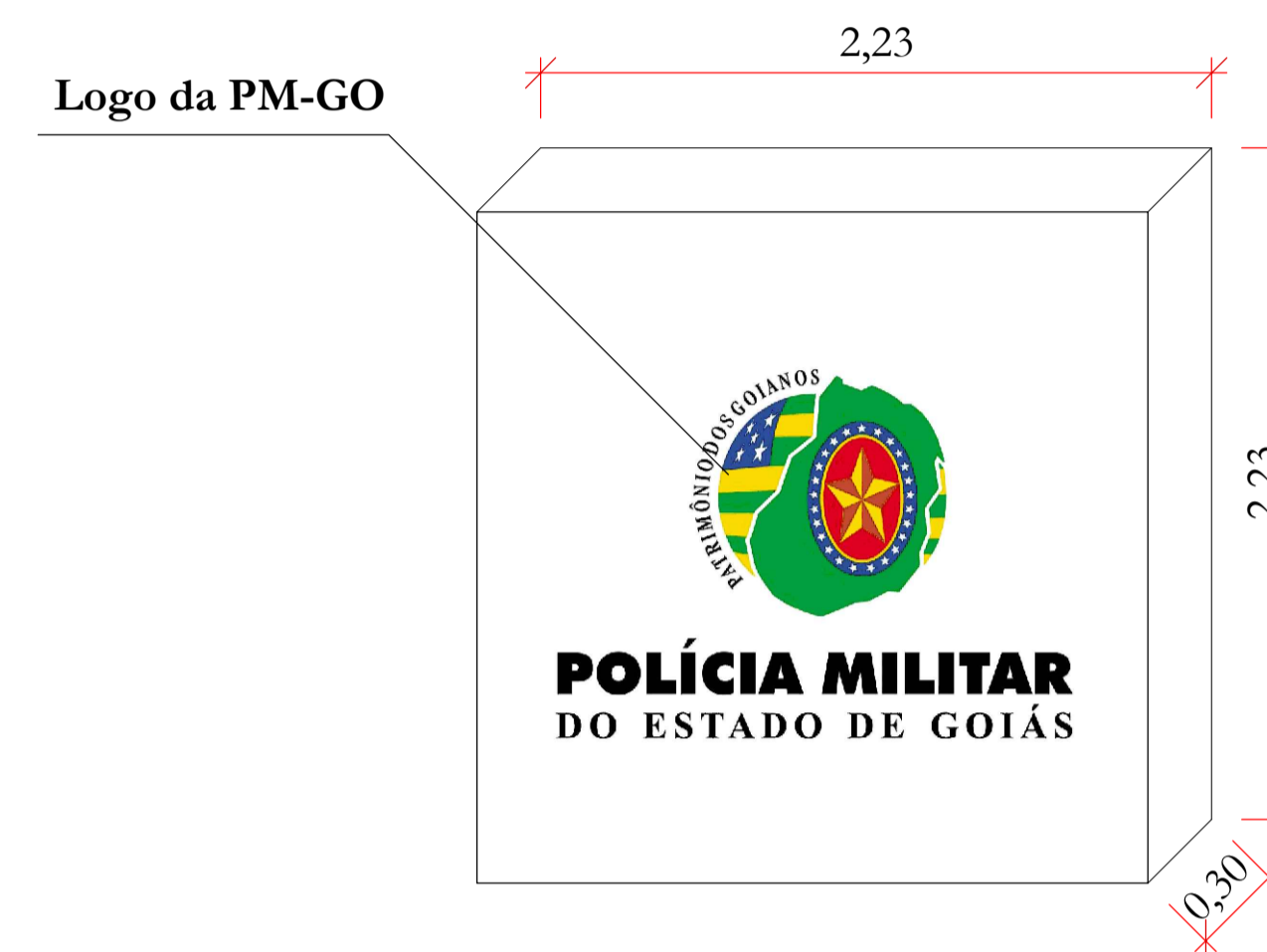
DETALHAMENTO LETREIRO 1 ESC. 1:25