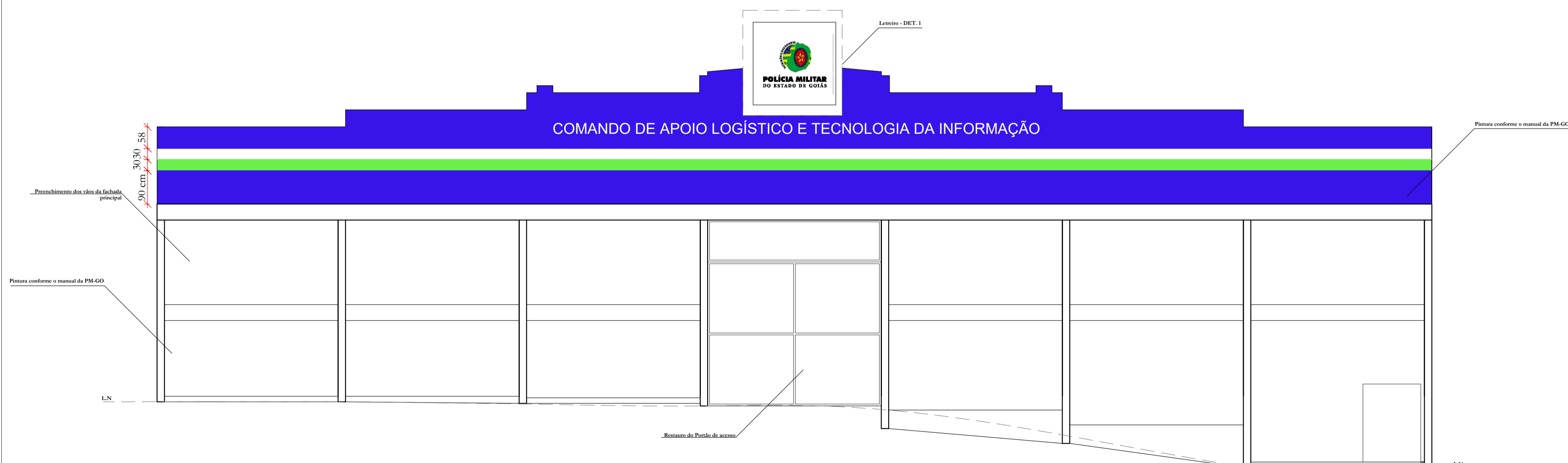
FACHADA PRICIPAL PROPOSTA ESC. 1:75