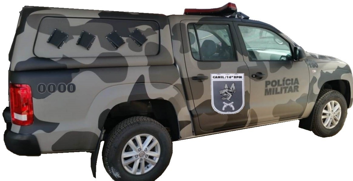
Figura 2 – Ilustração da plotagem do veículo (traseira e capô).