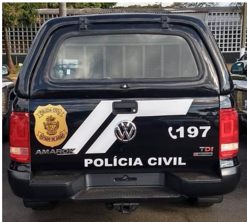
3 – Ilustração de viaturas da Polícia Técnico-Científica