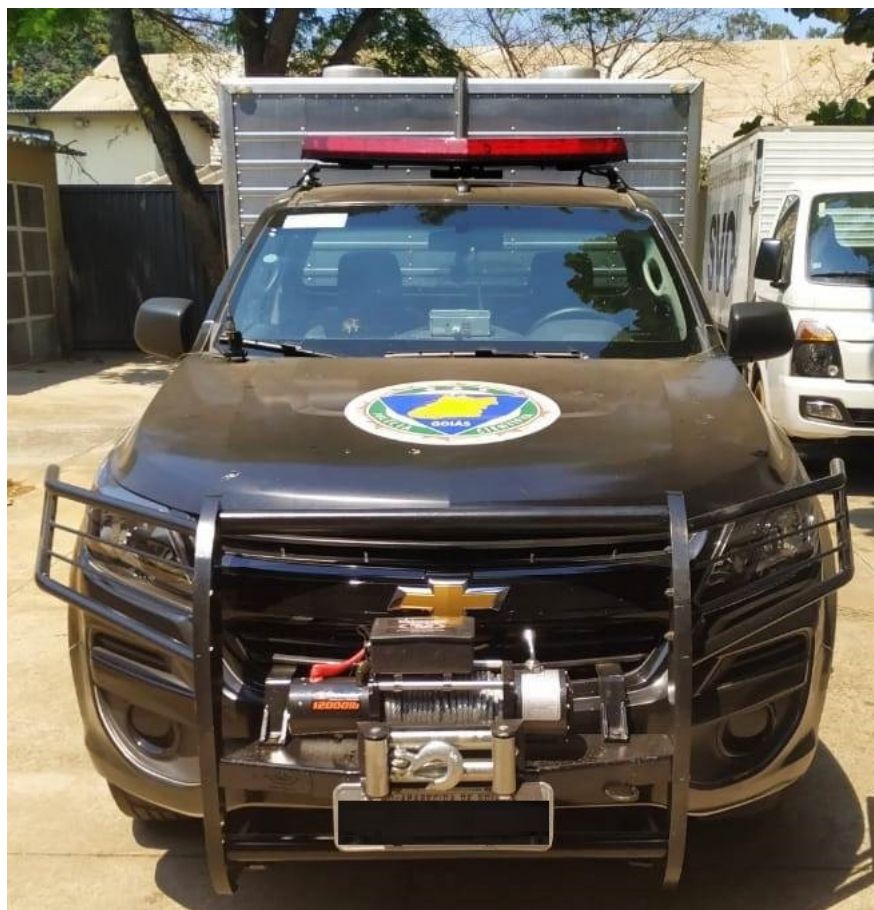
4 – Ilustração de viaturas da Diretoria-Geral da Administração Penitenciária