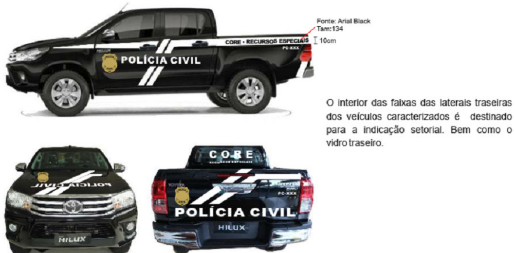
Figura 2 - Imagem meramente ilustrativa

SECRETARIA DE ESTADO DA SEGURANÇA PÚBLICA Superintendência de Gestão, Planejamento e Finanças Gerência de Licitações