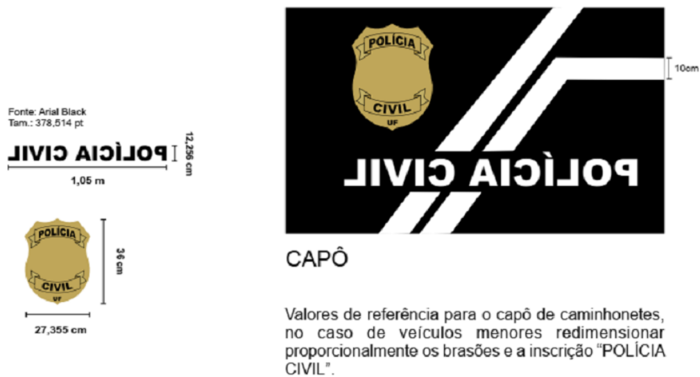
Figura 3 - Imagem meramente ilustrativa