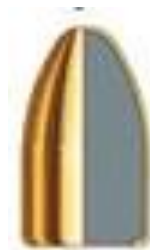
Imagem 02: Projétil FMJ/ETOG.

4.2.1 Tipo do encapsulamento: Full Metal Jacket – FMJ (Jaqueta metálica completa) ou Encamisada Total Ogival - ETOG.