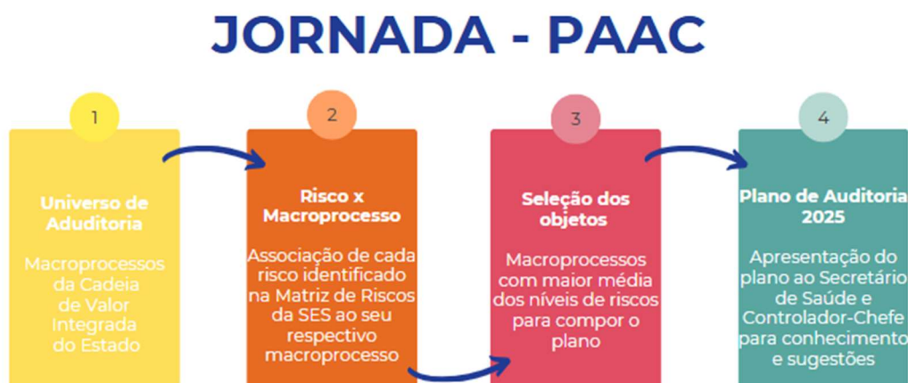
Figura 2 – Jornada do Planejamento das Ações de Controle

Os trabalhos essenciais, advindos da Avaliação de Riscos, foram selecionados conforme o fluxograma da Figura 2 abaixo: