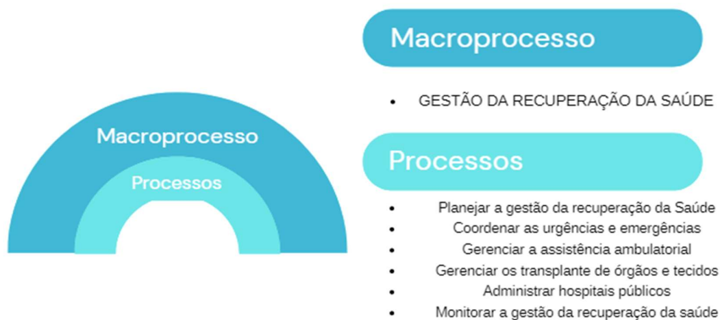
Figura 03 - Macroprocesso Gestão da Recuperação da Saúde - SES