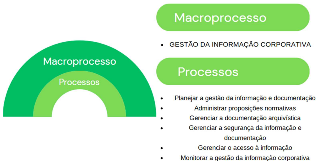
Figura 04 - Macroprocesso Gestão da Informação Corporativa – CASA CIVIL; SEAD