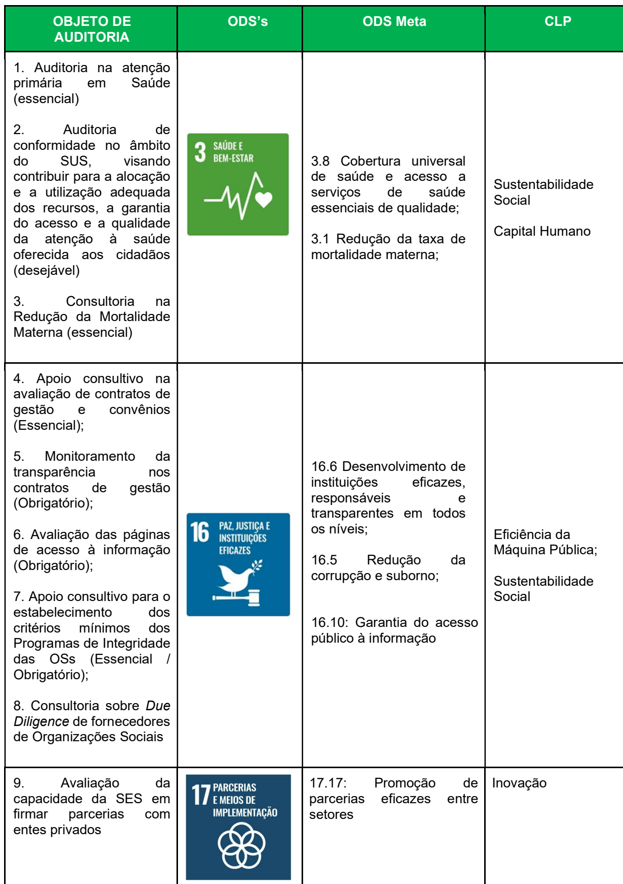
Quadro I – Correlação objetos auditáveis com ODS's e CLP