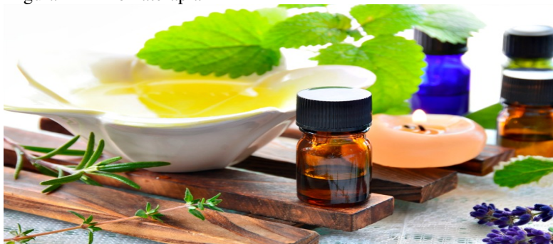
Figura III - Aromaterapia

Em 2018 a Portaria MS/GM 702/2018, altera a Portaria de Consolidação nº 2/GM/MS, de 28 de setembro de 2017, acrescentando alguns anexos e em um deles incluiu 10 novas PICS à PNPIC, as quais são: Apiterapia, Aromaterapia, Bioenergética, Constelação Familiar, Cromoterapia, Geoterapia, Hipnoterapia, Imposição de Mãos, Ozonioterapia e Terapia Florais (BRASIL, 2018).