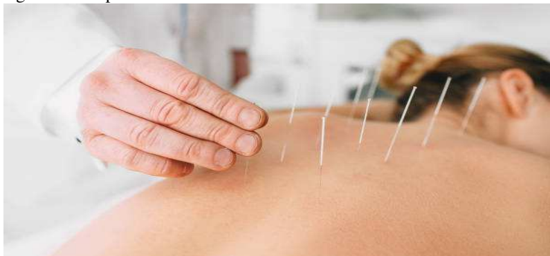
Figura I - Acupuntura

Em 2006, para atender a recomendação da OMS e as demandas definidas nas Conferências, o Ministério da Saúde (MS) aprova a Política Nacional de Práticas Integrativas e Complementares (PNPIC), por meio da Portaria GM/MS nº 971/2006. A princípio a PNPIC contemplou apenas cinco áreas a serem implantadas no SUS; Homeopatia, Fitoterapia, Acupuntura, Termalismo Social / Crenoterapia. Embora haja várias denominações para essas modalidades de tratamento e cura como terapêuticas não convencionais, o MS as denominou de “Práticas Integrativas e Complementares” (PICS) a partir da publicação da PNPIC (BRASIL, 2006).