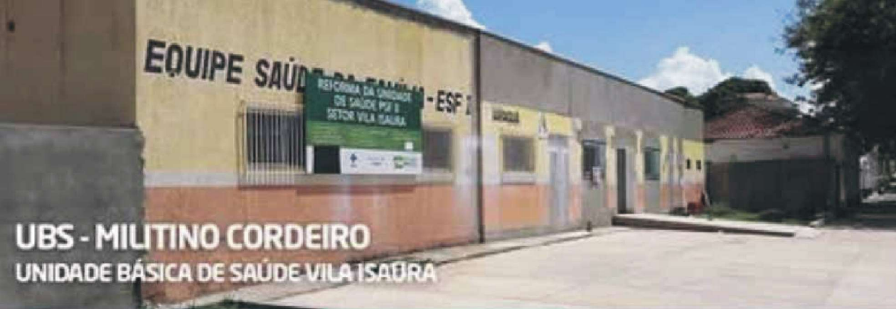
UBS - MILITINO CORDEIRO UNIDADE BÁSICA DE SAÚDE VILA ISAUARA