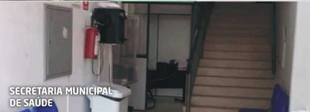
SECRETARIA MUNICIPAL DE SAÚDE