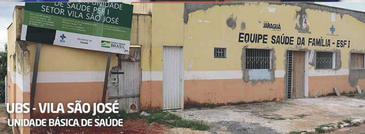
UBS - VILA SÃO JOSÉ UNIDADE BÁSICA DE SAÚDE