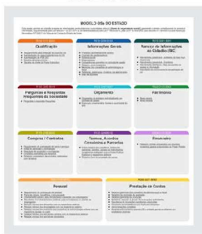
Sítio do órgão gestor