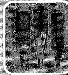
Esvazie e guarde garrafas sem uso de cabeça para baixo