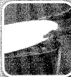
Tampe caixas d'água