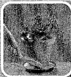
Coloque areia no pratinho dos vasos de plantas