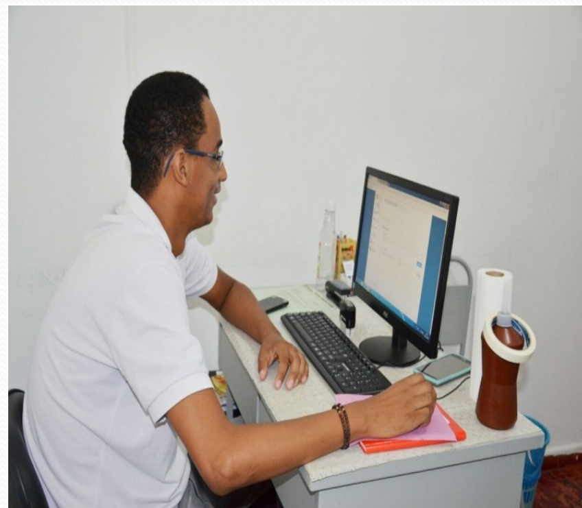
Atendimento de fisioterapia