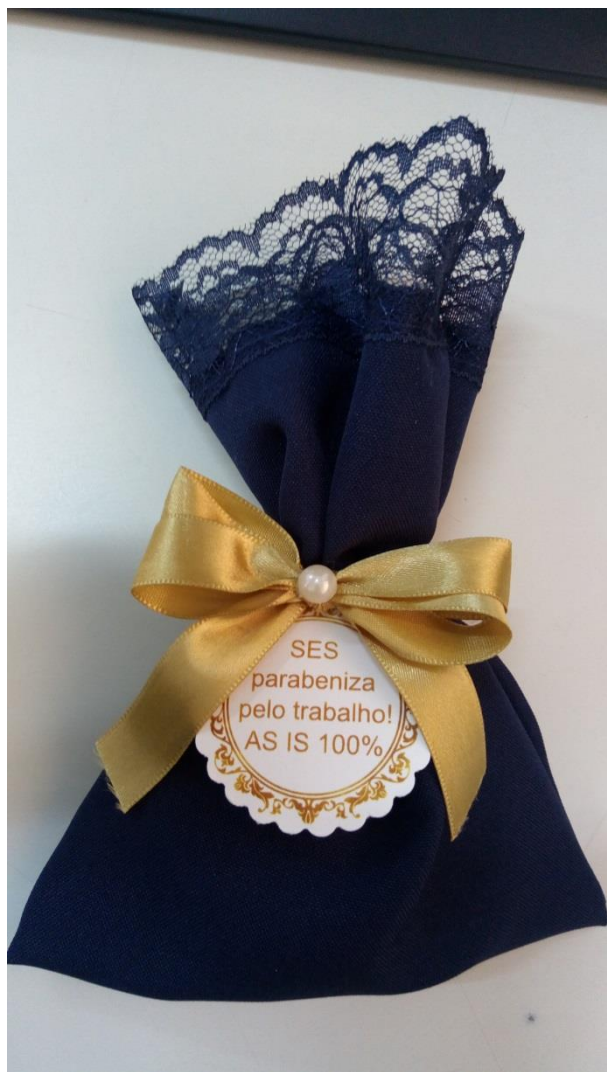
Lembrança entregue pelo ETG para a área reconhecida