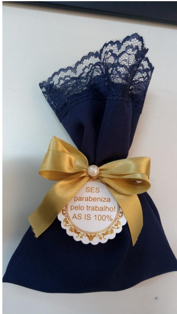
Lembrança entregue pelo ETG para as áreas reconhecidas