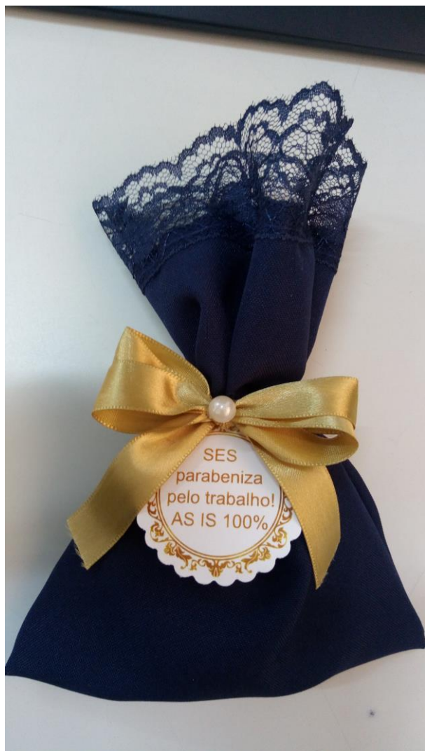
Lembrança entregue pelo ETG para a área reconhecida