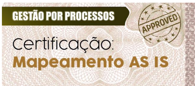
Selo de conclusão "AS-IS" 100%