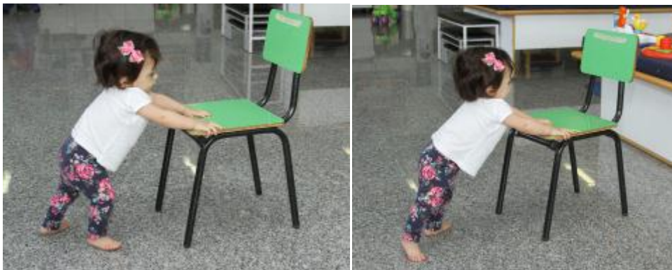
Figura 25 – Estimulação da marcha empurrando uma cadeira

Com a criança apoiada em um móvel ou em outra pessoa promover o desequilíbrio para frente, trás e lados estimulando as estratégias de equilíbrio do tornozelo e quadril. Incentivar a marcha lateral com apoio, progredir para marcha para frente com apoio seja empurrando uma cadeira, banco ou mesmo um andador infantil. Ao estimular a marcha com o apoio de uma ou ambas as mãos do estimulador é necessário estar atento a não incentivar a extensão dos ombros da criança (manter os braços para cima), pois essa posição altera a descarga de peso e com isso dificulta a aquisição do equilíbrio de pé seja estático ou dinâmico. O melhor ponto de apoio para estimulação da marcha é pelo quadril.