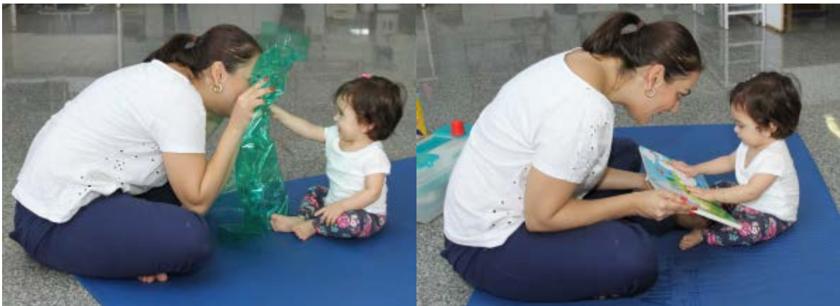
Figura 28 – Mãe brincando com a criança e incentivando o papel de interlocutor

para o desenvolvimento da articulação dos sons e das habilidades verbais e, nessa medida, apontam direções à estimulação precoce da funcionalidade orofacial, bem como sugerem aspectos a serem considerados na orientação às famílias de crianças com transtornos no desenvolvimento neuropsicomotor, uma vez que os processos de alimentação e de aquisição de linguagem se dão, principalmente, a partir do vínculo mãe/bebê, das relações e do contexto familiar (PORTO-CUNHA; LIMONGI, 2008; DADA; ALANT, 2009).