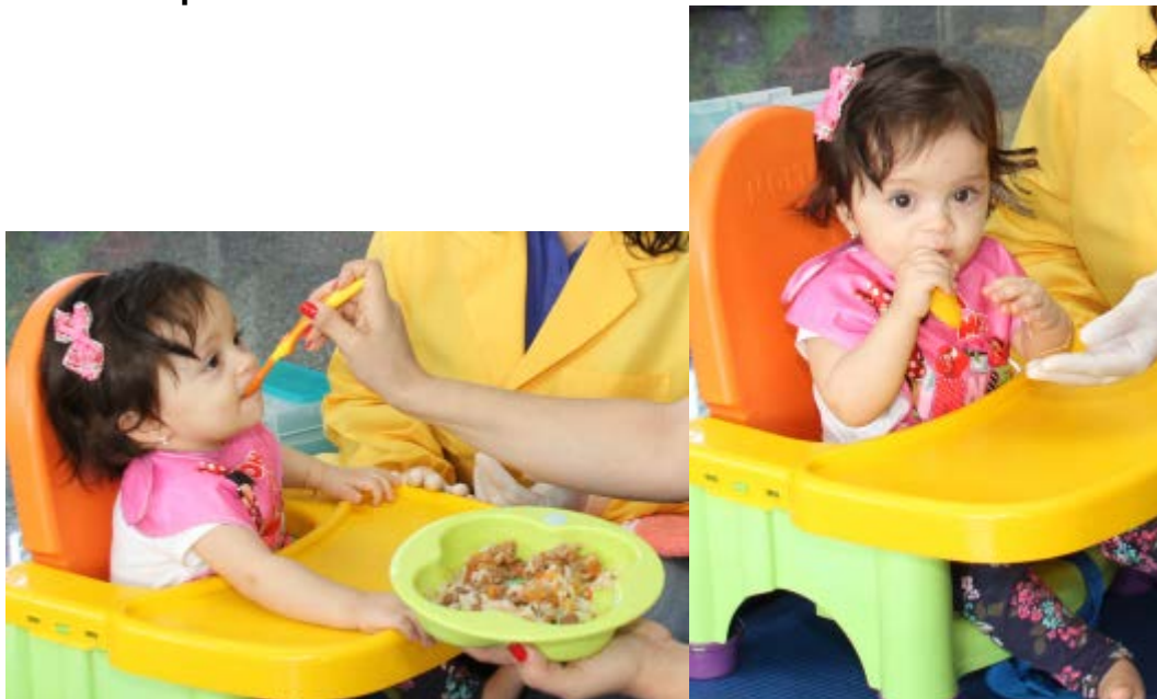
Figura 31 – O momento da alimentação deve ser aproveitado pelos familiares para estimular a motricidade oral