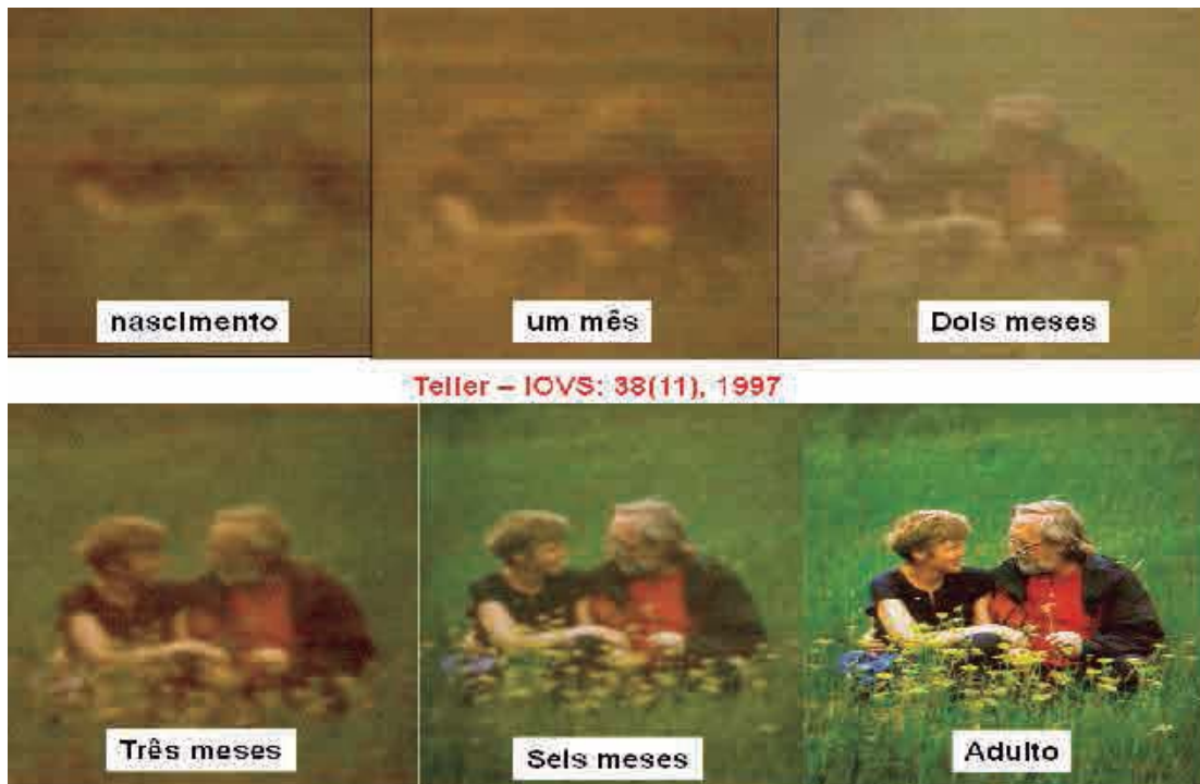
Figura 2 – Como a criança enxerga