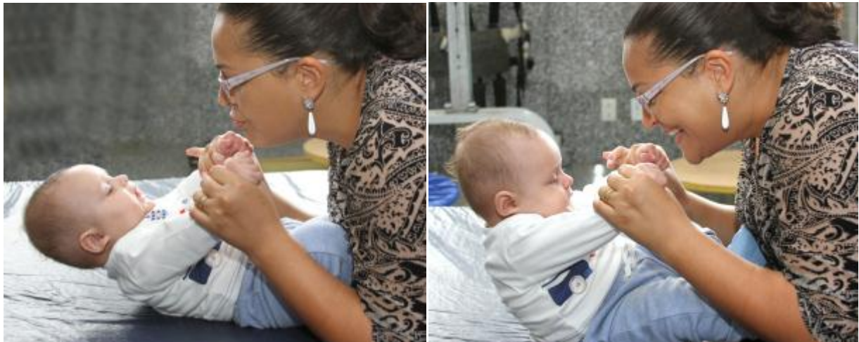
Figura 14 – Teste do puxado para sentar sendo utilizado para estimulação do controle cervical na postura em supino