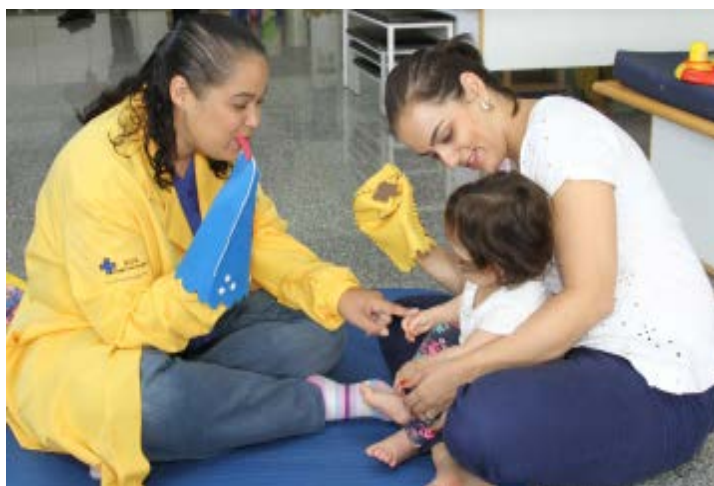
Figura 29 – Ensinando a mãe a estimular a linguagem pela contenção de histórias com fantoches