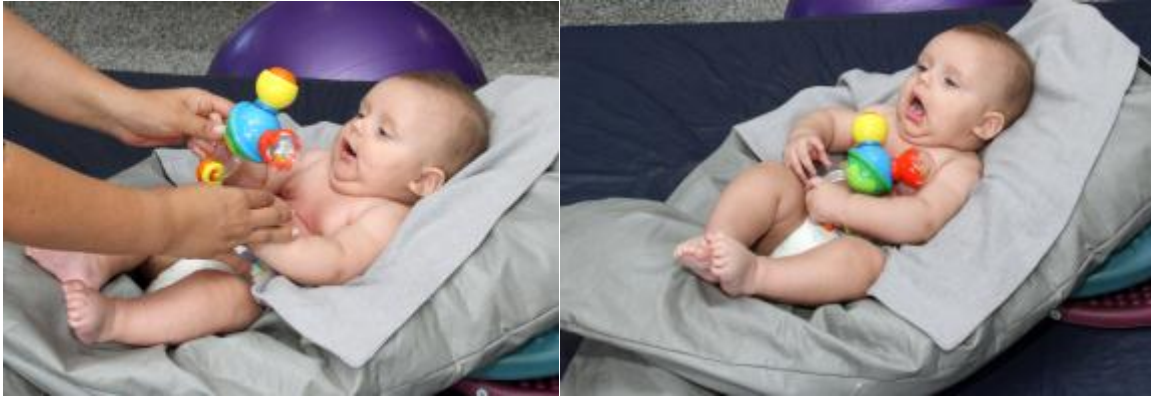
Figura 11 – Criança posicionada em uma boia de pano (feita com uma calça comprida preenchida de retalhos – a chamada calça da vovó)