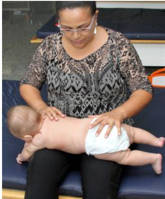
Figura 16 – Estimulação do rolar utilizando o colo (pernas) do estimulador como facilitador do movimento