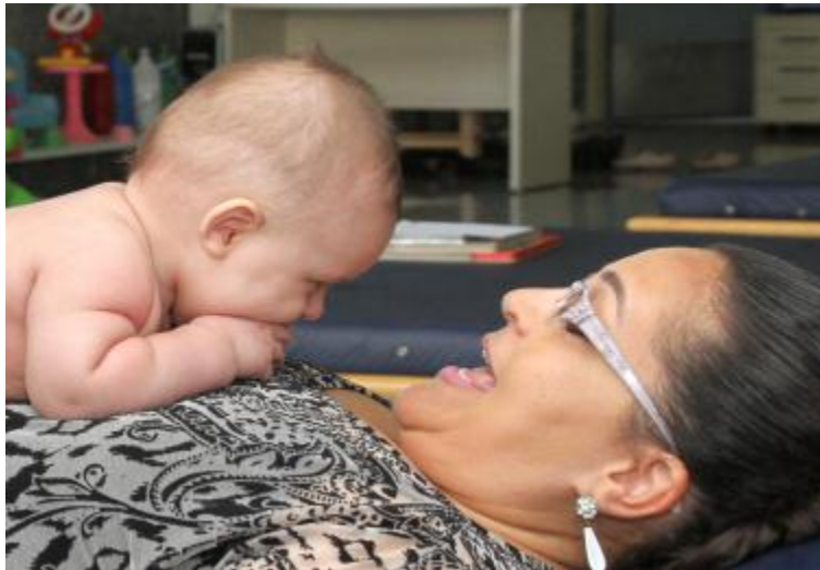
Figura 15 – Criança deitada sobre o peito da mãe. A curiosidade e a relação de afeto com o estimulador facilitam a extensão cervical