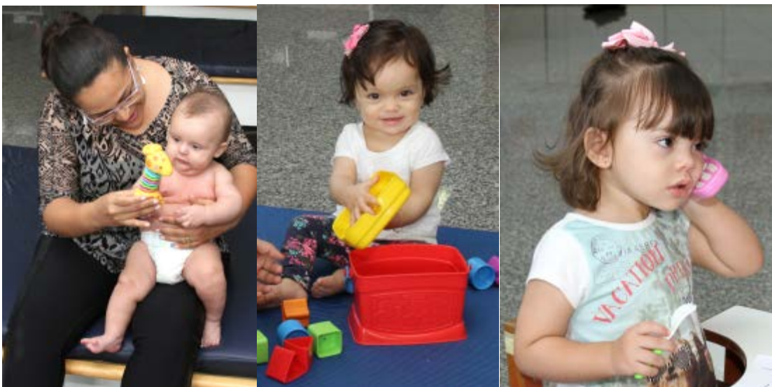
Figura 32 – O brincar, quando adequadamente dirigido, consiste na ferramenta mais importante dos programas de estimulação precoce com crianças nas mais diversas faixas etárias

brincar, naturalmente, também é meio para alcançar objetivos da estimulação precoce: desenvolvimento da habilidade motora fina; controle postural; desenvolvimento de conceitos; oportunidade de descobrir novas fronteiras de desenvolvimento; ensaio de papéis sociais e ocupacionais; exploração dos sentidos do mundo em que vive; desenvolvimento de habilidades perceptuais e intelectuais; aquisição de linguagem e integração de habilidades cognitivas 3 .