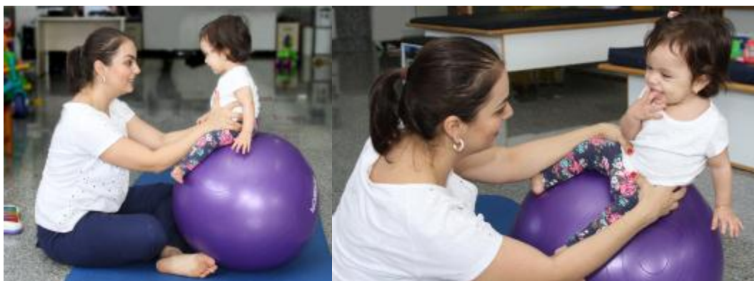
Figura 20 – Atividades em bola suíça para ativação da musculatura de tronco e estimulação do sentar