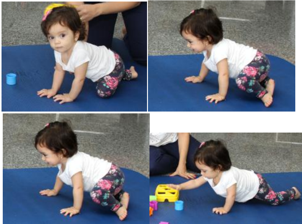
Figura 22 – Criança assumindo a postura de gatas a partir do side-sitting até alcançar o objeto

A estimulação do engatinhar propriamente dita pode ser feita com o incentivo de um brinquedo a frente da criança e a facilitação dos movimentos alternados de braço e pernas.