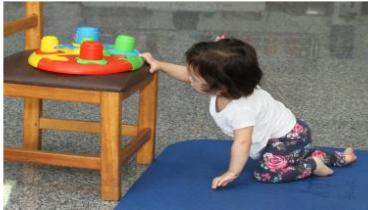
Figura 23 – Criança assumindo a postura ajoelhada com apoio