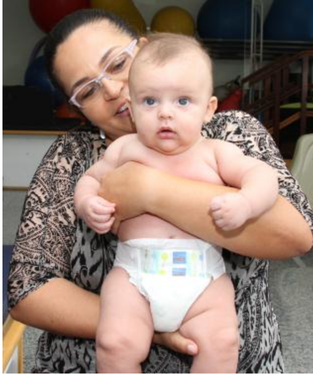
Figura 19 – Postura mais adequada para carregar a criança no colo, permitindo o olhar para frente e a liberação dos braços para o alcance

prática de colocar a criança no ombro com o rosto voltado para trás ou deitado no colo.