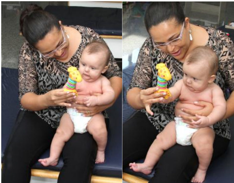
Figura 18 – Estimulação da postura sentada no colo da mãe