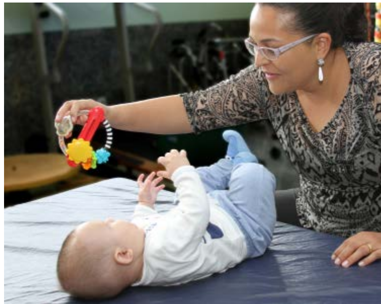
Figura 7 – Estímulo por meio de localização sonora utilizando brinquedo que emite sons

articulação da fala. Iniciando assim a possibilidade de discriminação dos sons. Os sons que a criança é capaz de emitir são muito ricos e variados e, por essa razão, deve se dar oportunidade de exercitar os movimentos de boca e lábios constantemente (BARATA; BRANCO, 2010).