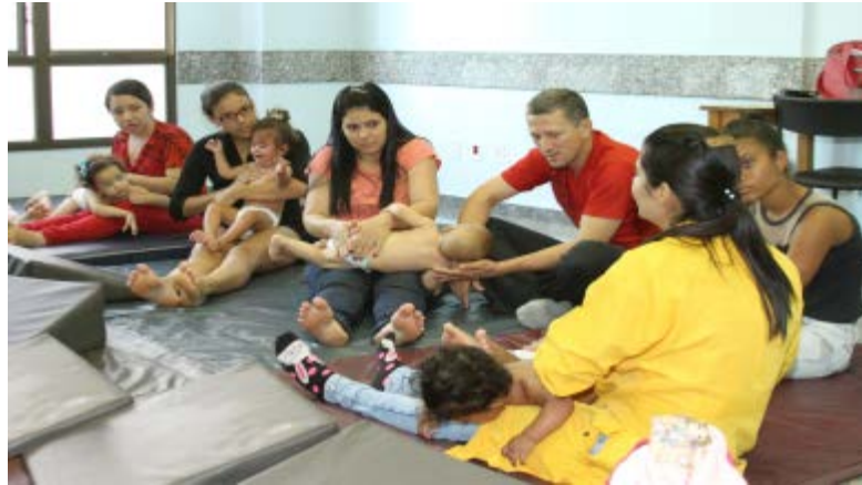
Figura 33 – Familiares sendo orientados durante encontro no Grupo de Estimulação Precoce