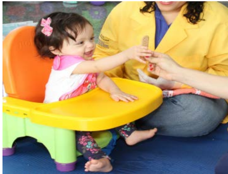
Figura 27 – Alcance, preensão e manipulação utilizando objetos concretos do cotidiano da criança