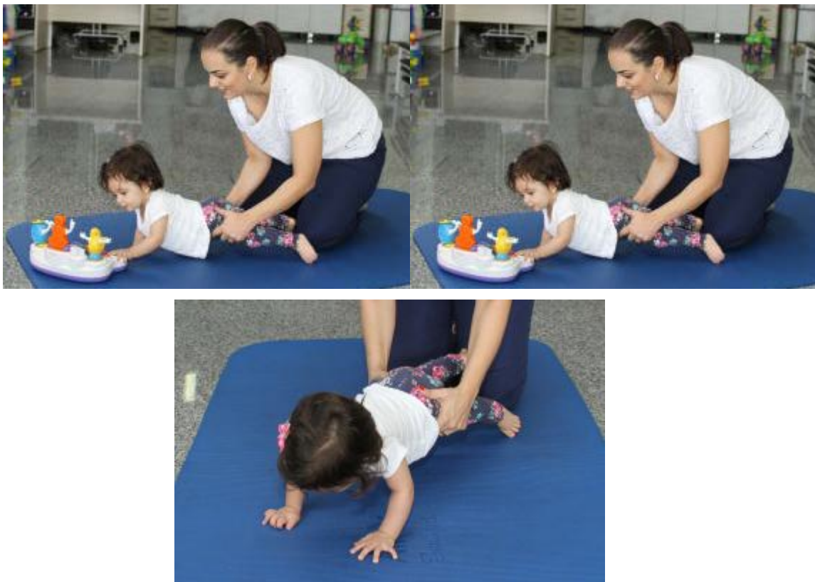
Figura 21 – Brincando de “carrinho de mão” para fortalecer cintura escapular e extensores de cotovelo, preparando para o engatinhar

Para que o bebê consiga se manter na postura de gatas é necessário que ele tenha uma boa fixação de cintura escapular e pélvica. Atividades que promovam o apoio de mão com cotovelos estendidos, utilizando bola, rolo, cunha, colo do terapeuta e até atividades mais elaboradas como a brincadeira do “carrinho de mão” são úteis para aquisição dessa habilidade.