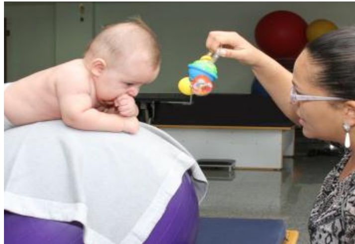
Figura 13 – A bola suíça sendo utilizada como recurso terapêutico para estimulação do controle cervical

Podemos ainda utilizar para esse objetivo bolas terapêuticas, cunhas de espuma e até mesmo o colo do estimulador. O puxado para sentar pode ser utilizado como estimulação desde que o bebê já tenha um controle cervical inicial.