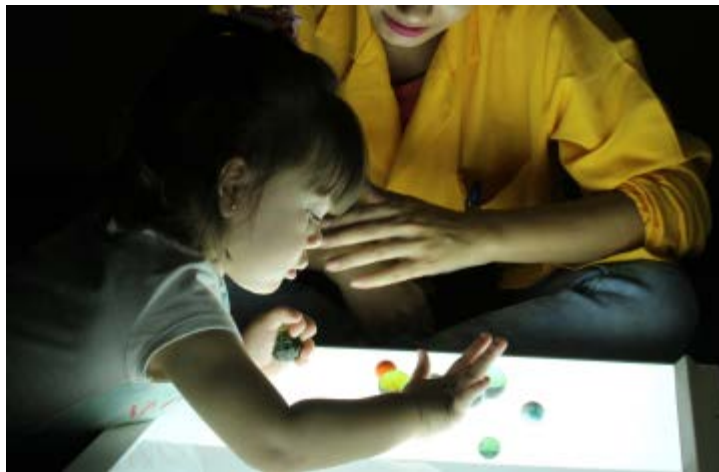
Figura 8 – Criança brincando em ambiente escuro utilizando objeto luminoso