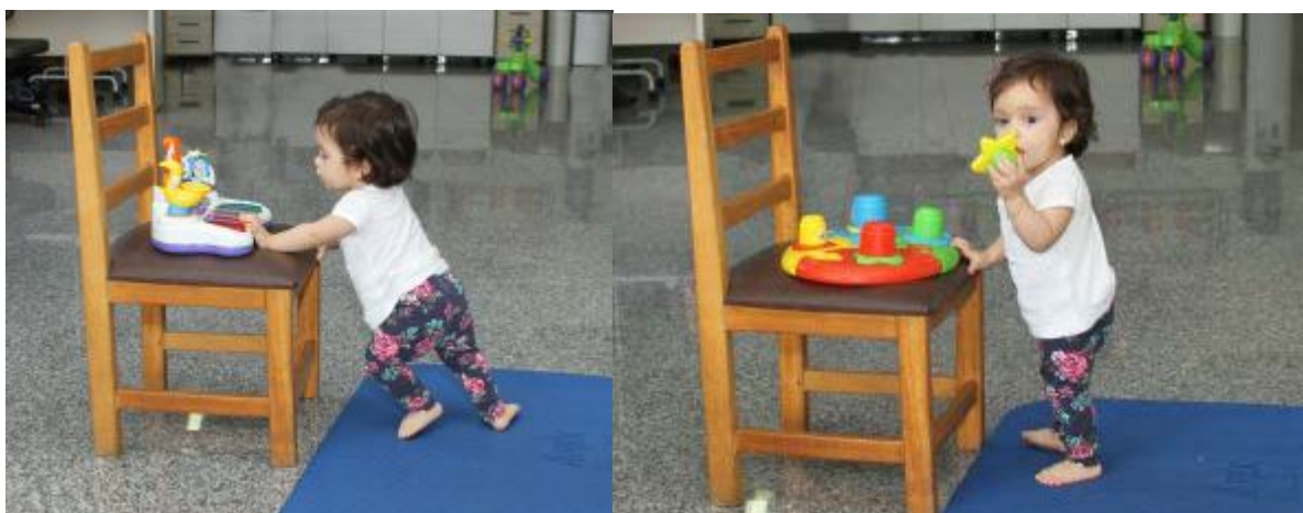
Figura 24 – Assumindo a postura ortostática a partir do semiajoelhado

O semiajoelhado é uma postura de transição e muito utilizada para atingir a postura ortostática. Aproveite a atividade da postura ajoelhada e incentive a passagem do pé para frente, ora de um lado, ora de outro. Pode-se mantê-la a postura de frente para o espelho ou posicionar a criança de frente para o terapeuta. Esse tipo de postura fortalece o vínculo do estimulador com a criança, tornando a atividade mais eficaz e prazerosa.