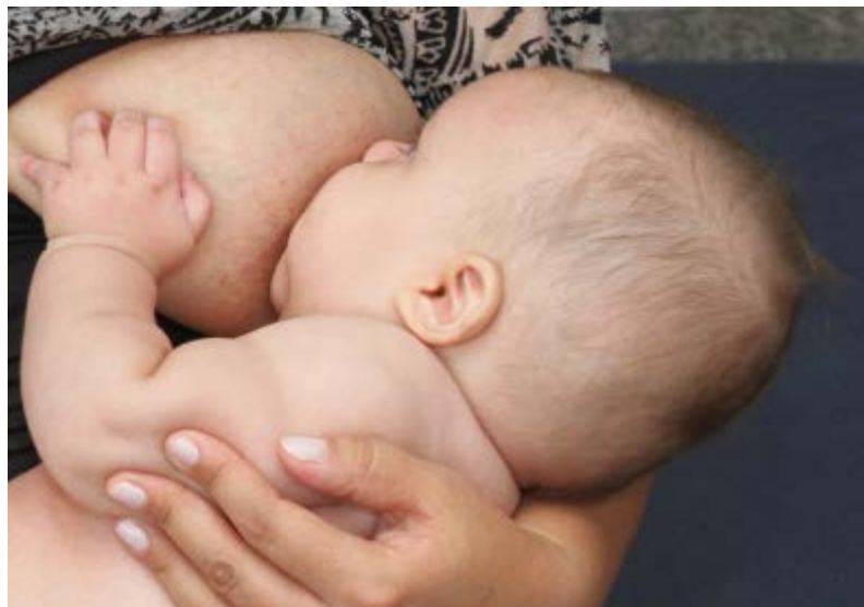
Figura 6 – Bebê em aleitamento materno

Esse ato exige um grande esforço de todos os músculos da face, estimulando o crescimento da mandíbula e prevenindo futuros problemas nos dentes e ossos da face (por exemplo, os dentes superiores projetados para frente ou pouco desenvolvimento do queixo/mandíbula). A ordenha só ocorre no seio materno. Nenhum tipo de bico artificial possibilita todos esses movimentos mandibulares, fundamentais para o desenvolvimento facial e mandibular.