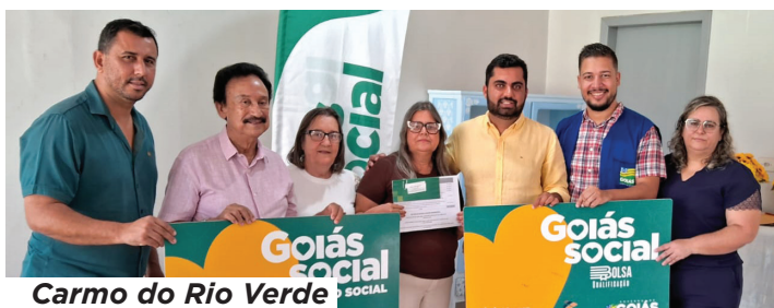
Carmo do Rio Verde

Embora as histórias que atravessam essas cidades tenham rostos diferentes, idades variadas e objetivos próprios, todos