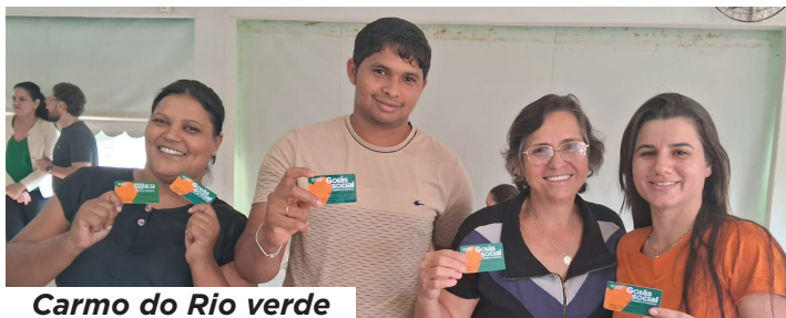
Carmo do Rio verde