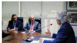
Foto: Caiado recebe novo embaixador da Índia em Goiânia para discutir parcerias bilaterais entre Goiás e o país asiático.

O governador Ronaldo Caiado (PPS) recebeu, nesta segunda-feira (11/9), o novo embaixador da Índia no Brasil, Dinesh Bhatia, para reforçar a aproximação entre Goiás e o país asiático. O encontro, realizado no Palácio Pedro Ludovico Teixeira, teve como foco central a articulação