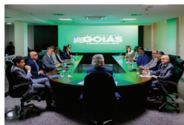
Foto: Caiado recebe novo embaixador da Índia e define parcerias bilaterais entre Goiás e o país asiático.