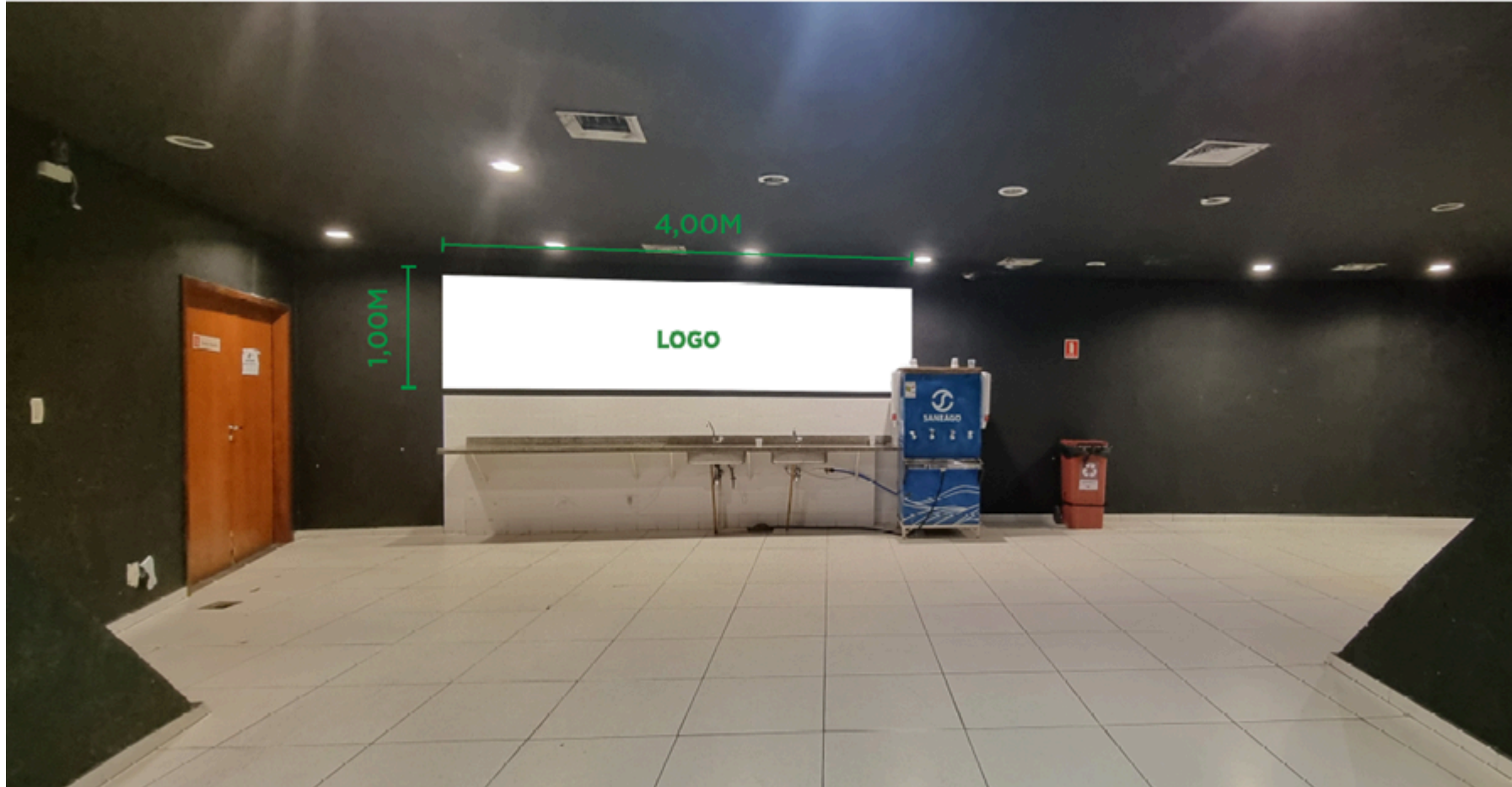
Figura 03 - Banner Bares

2.1.4. O BANNER indicado para ser instalado na parede lateral da entrada principal terá uma face e poderá ter as dimensões máximas de 7,80 m (sete metros e oitenta centímetros) de largura e 3,00 m (três metros) de altura.