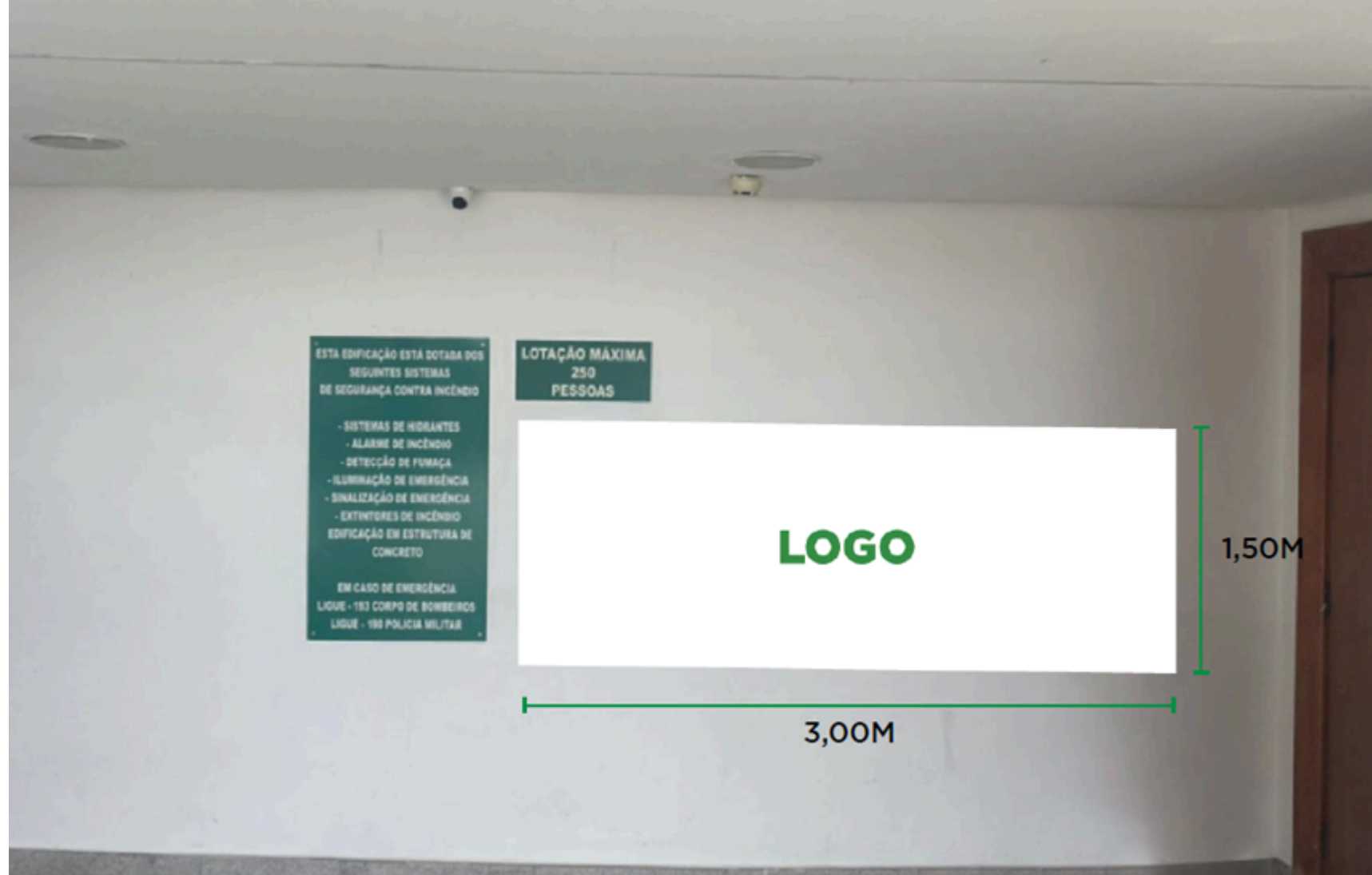
Figura 05 - Banner Hall de entrada do Mezanino

2.1.6. Os 07 (sete) BANNERS indicados a serem instalados nos suportes (picolés) ao lado da GO-020, poderão dispor de uma ou mais faces, respeitada a regra de dimensões máximas de até 90 cm (noventa centímetros) de largura e 3,89 cm (três metros e oitenta e nove centímetros) de altura cada e demais normas, regulamentos e orientações do Centro Cultural Oscar Niemeyer e da Prefeitura Municipal de Goiânia.