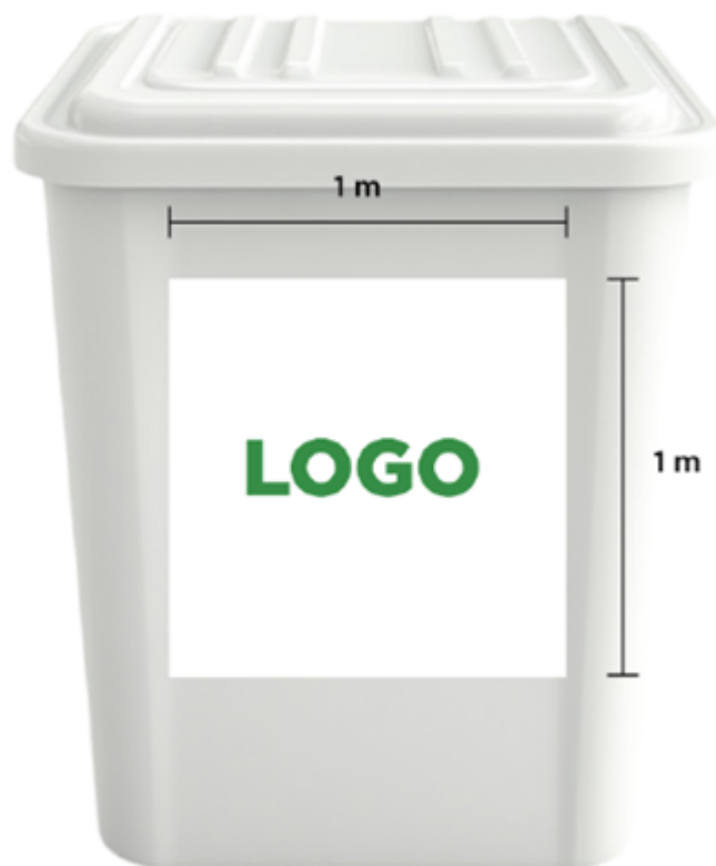
Figura 10 - Lixeiras personalizadas

2.1.11. 02 (duas) PROJEÇÕES EM TELÕES a serem instalados nas paredes laterais ao palco e poderão ter dimensões máximas de 4,00 m (quatro metros) de largura e 3,00 m (três metros) de altura cada;