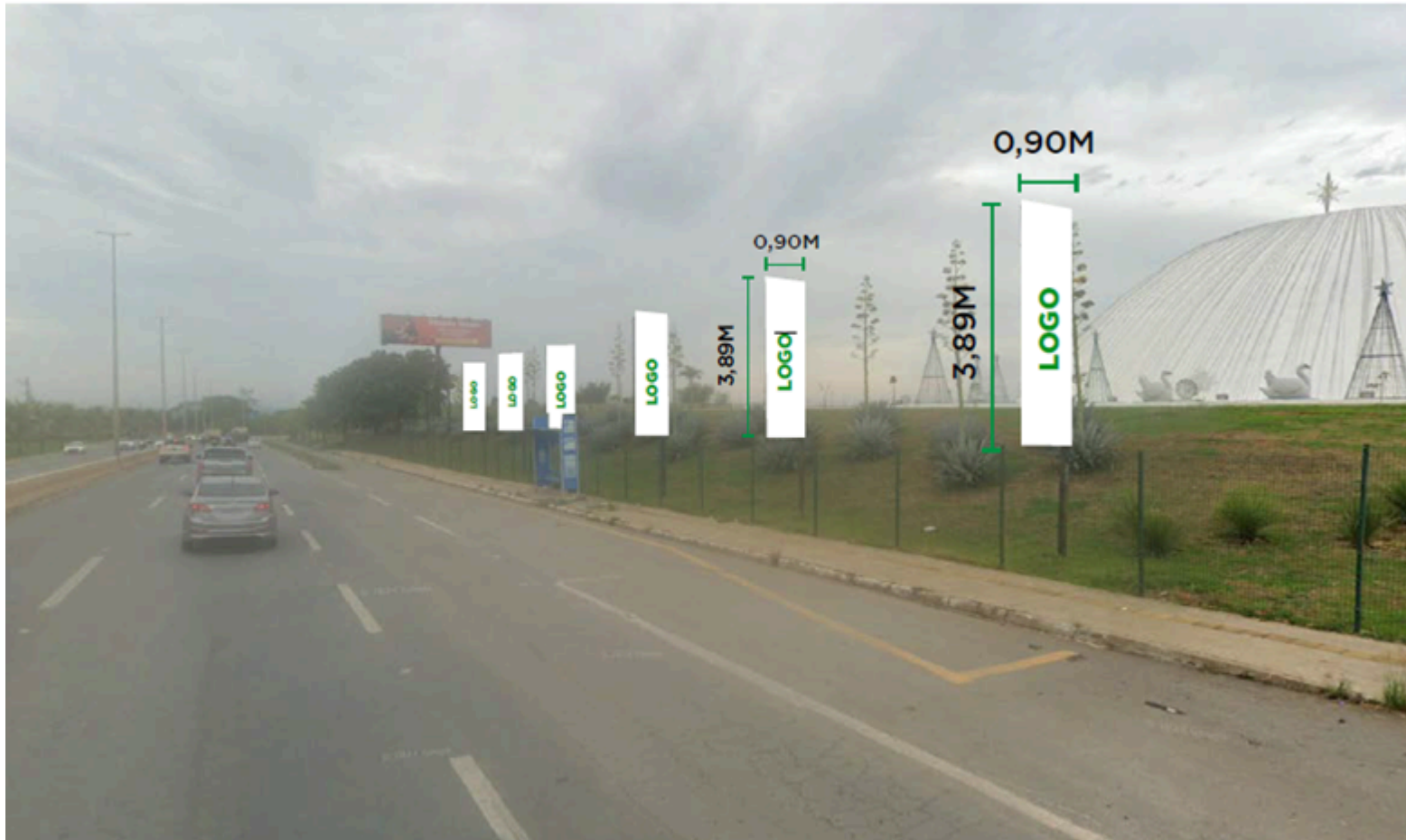
Figura 06 - Banner suportes (picolés) ao lado da GO-020

2.1.7. Deverão ser instalados ADESIVOS na face vertical dos degraus da escada de acesso à entrada principal do Palácio da Música, sendo as dimensões de 14,50 m (catorze vírgula cinquenta metros) de largura e 0,18 m (zero vírgula dezoito metros) de altura;