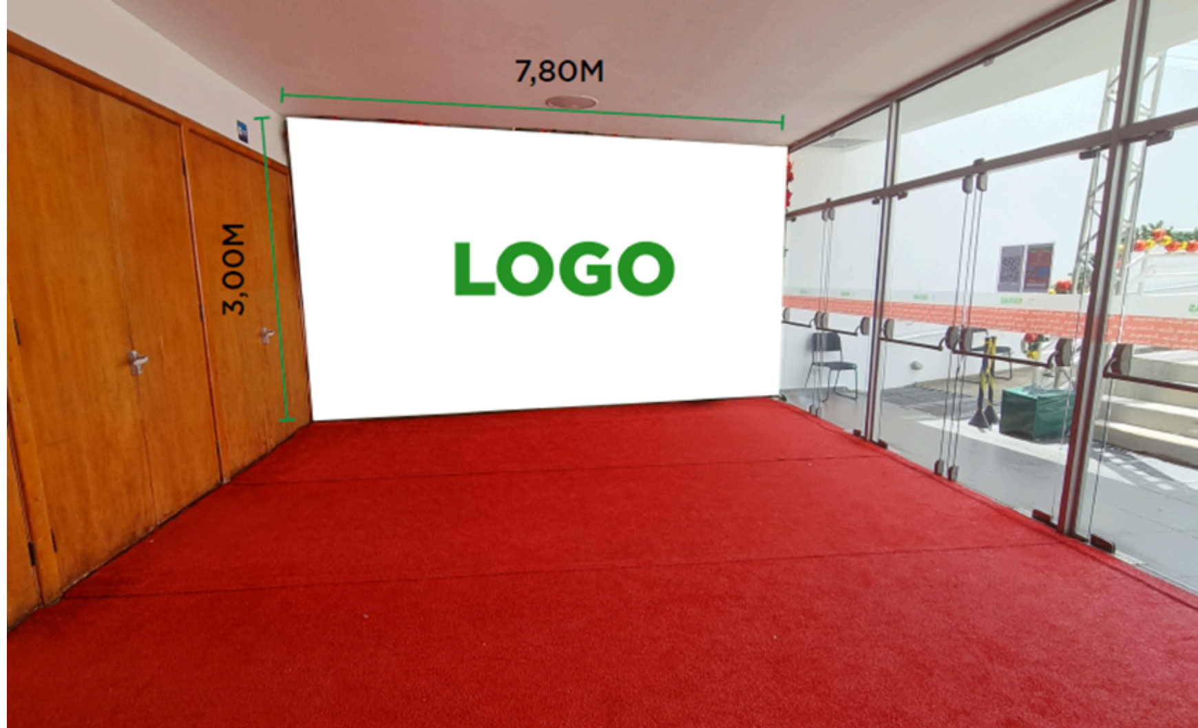
Figura 04 - Banner Parede Lateral entrada Principal

2.1.5. O BANNER indicado para ser instalado na parede frontal do Hall de entrada do Mezanino, terá uma face e poderá ter as dimensões máximas de 1,50 m (um metro e cinquenta centímetros) de largura e 3,00 m (três metros) de altura;