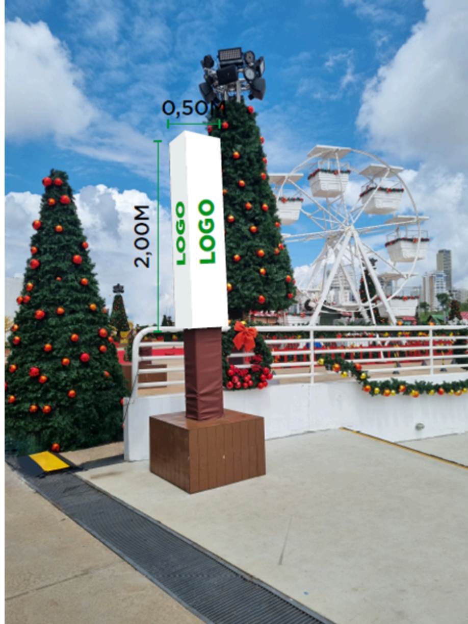
Figura 02 - Totem Fixo

2.1.3. Os 02 (dois) BANNERS a serem instalados nos bares, terão uma face e poderão ter as dimensões máximas de 4,00 m (quatro metros) de largura e 1,00 m (um metro) de altura;