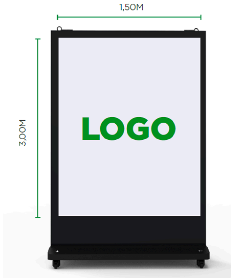
Figura 09 - DISPLAY DE LED (MUPI)

2.1.10. 04 (quatro) LIXEIRAS personalizadas poderão ser utilizadas em todas as suas faces, as quais terão dimensões máximas de 1,00 m (um metro) de largura e 1,00 m (um metro) de largura;