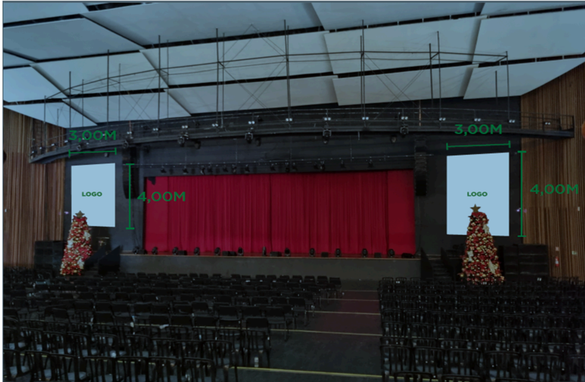
Figura 11 - Projeções na lateral do Palco

2.2. Além das mídias visuais, outro instrumento de publicidade a ser disponibilizado poderá ser ÁUDIO Spot Institucional 60" do CESSIONÁRIO.