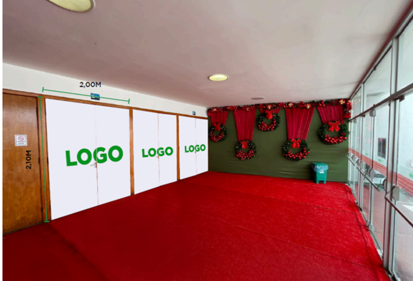
Figura 08 - Adesivos nas portas na entrada principal

2.1.9. 01 (um) DISPLAY DE LED (MUPI) indicado para instalação no hall de entrada principal com dimensões máximas de 1,50 m (um metro e cinquenta centímetros) de largura e 3,00 m (três metros) de altura;