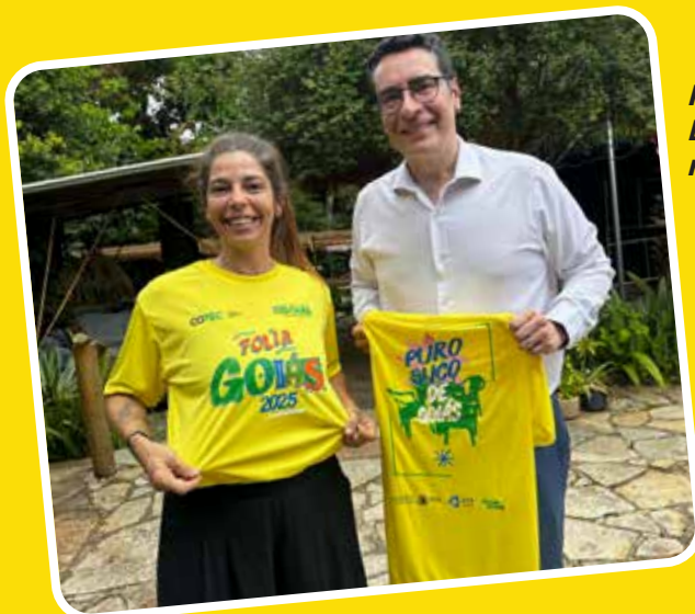
Pirenópolis - Bloco Zaza- ricando