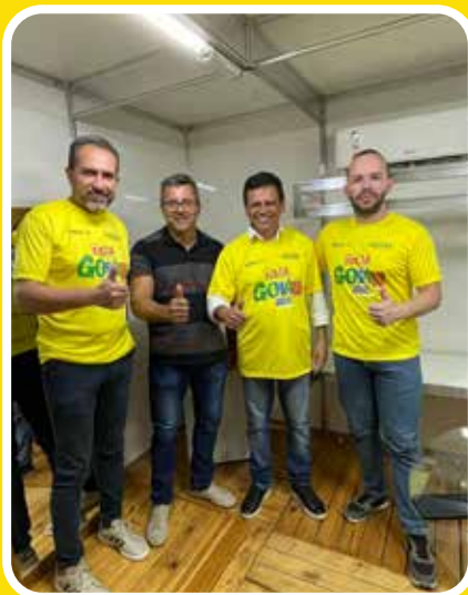
Anicuns - Bloco da terceira idade de Ipameri