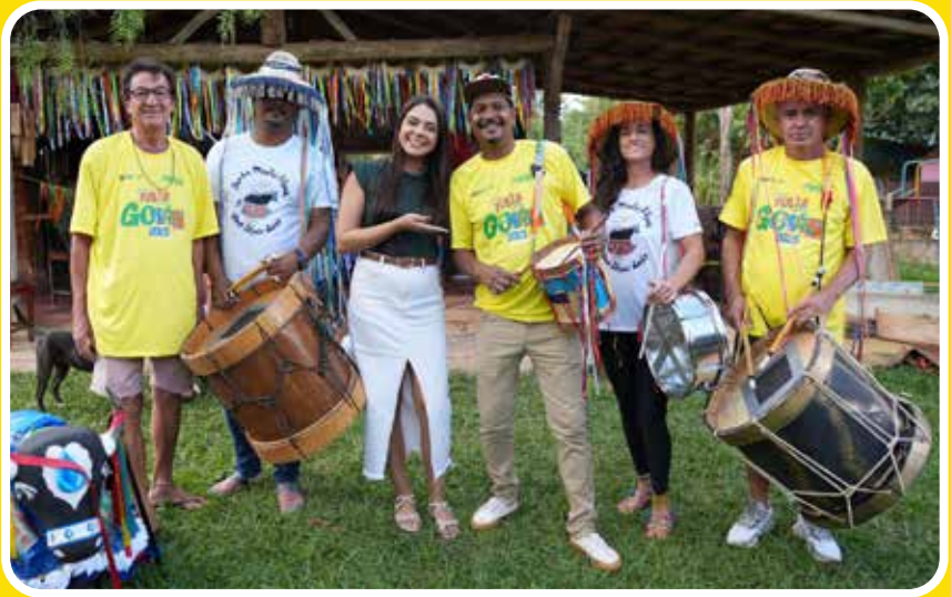
Alexania - Bloco Bumba meu Boi

O carnaval no interior goiano será animado e contará com aporte financeiro do Governo de Goiás. Foram selecionados blocos de 16 municípios goianos. Todas as atrações são gratuitas. O apoio aos blocos foi feito através de edital de seleção. A Secretaria da Retomada formalizou o apoio aos municípios durante a última semana. No total, foram R$ 2 milhões investidos nos municípios do interior para a realização das festividades e fomentar a cultura carnavalesca em Goiás.