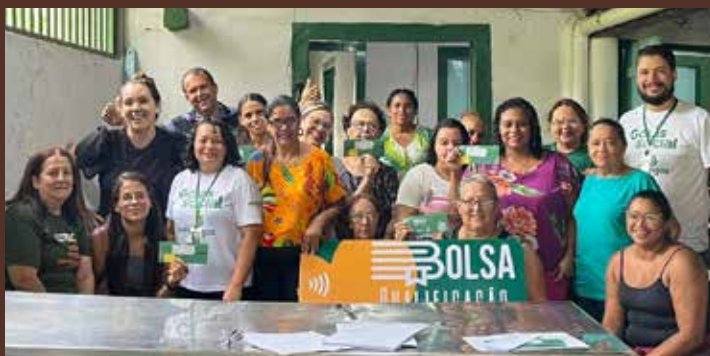
Cidade de Goiás