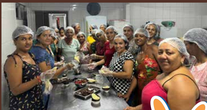
Cidade de Piranhas