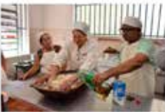
Cotec, em Goiás, oferece mais de 20 mil vagas em cursos gratuitos para 2020 g1 - 06/06/2019