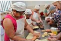
Governo de Goiás abre 20.770 vagas em cursos gratuitos O Colégio Tecnológico do Estado de Goiás (CTEG) está com inscrições abertas para 20.770 vagas nos cursos profissionalizantes gratuitos, sendo sempre renovadas até 2020. g1 - 06/06/2019