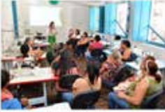
Governo de Goiás abre 20.770 vagas em cursos profissionalizantes gratuitos O Colégio Tecnológico do Estado de Goiás (CTEG) está com inscrições abertas para 20.770 vagas nos cursos profissionalizantes gratuitos, sendo sempre renovadas até 2020. g1 - 06/06/2019