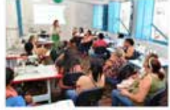
Governo de Goiás abre 20.770 vagas em cursos gratuitos O Colégio Tecnológico do Estado de Goiás (CTEG) está com inscrições abertas para 20.770 vagas nos cursos profissionalizantes gratuitos, sendo sempre renovadas até 2020. g1 - 06/06/2019