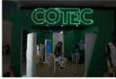
COTEC Goiás abre inscrições para cursos profissionalizantes no estado São mais de 800 vagas de nível a média técnica, distribuídas em 27 unidades, abertas a alunos a partir de 18 anos. g1 - 06/06/2019