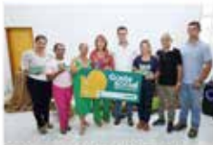
Proletários recebem benefícios do Crédito Social em Amâncio Fora o apoio do PPS, que promove a formação em educação de subalternidade, a Agência Estadual de Assistência Social, Entidade Reguladora e Promotora de Bem-Estar Social (Ages) está... g1 - 06/06/2019