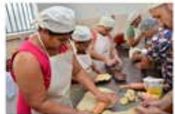
Abertas 20.770 vagas em cursos gratuitos do CTEG O Colégio Tecnológico do Estado de Goiás (CTEG) está com inscrições abertas para 20.770 vagas nos cursos profissionalizantes gratuitos, sendo sempre renovadas até 2020. g1 - 06/06/2019