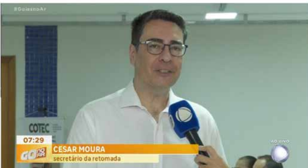
Programa Mais Emprego está oferecendo mais de 4 mil vagas