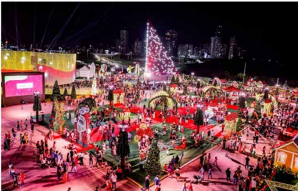
Natal do Bem atinge marca de meio milhão de visitantes em Goiânia - @aredacao