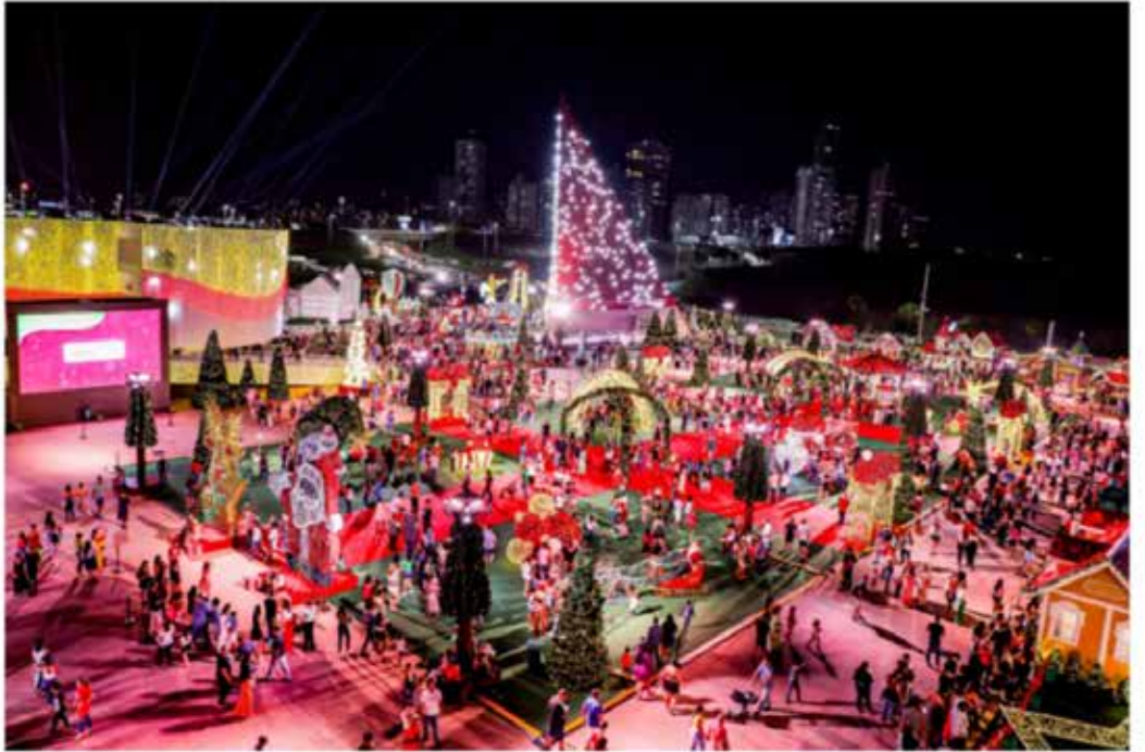
Natal do Bem chega à marca de meio milhão de visitantes em 2023

Evento promovido pelo Goiás Social é considerado o maior do país com entrada gratuita e espera atingir 1 milhão de pessoas ao longo das festividades natalinas