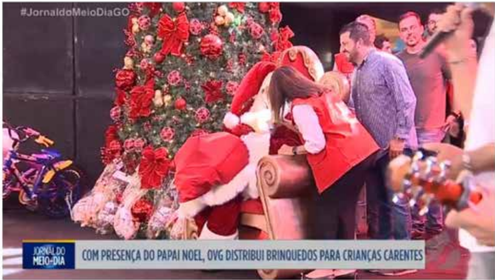
Natal do Bem distribui brinquedos em Goiânia