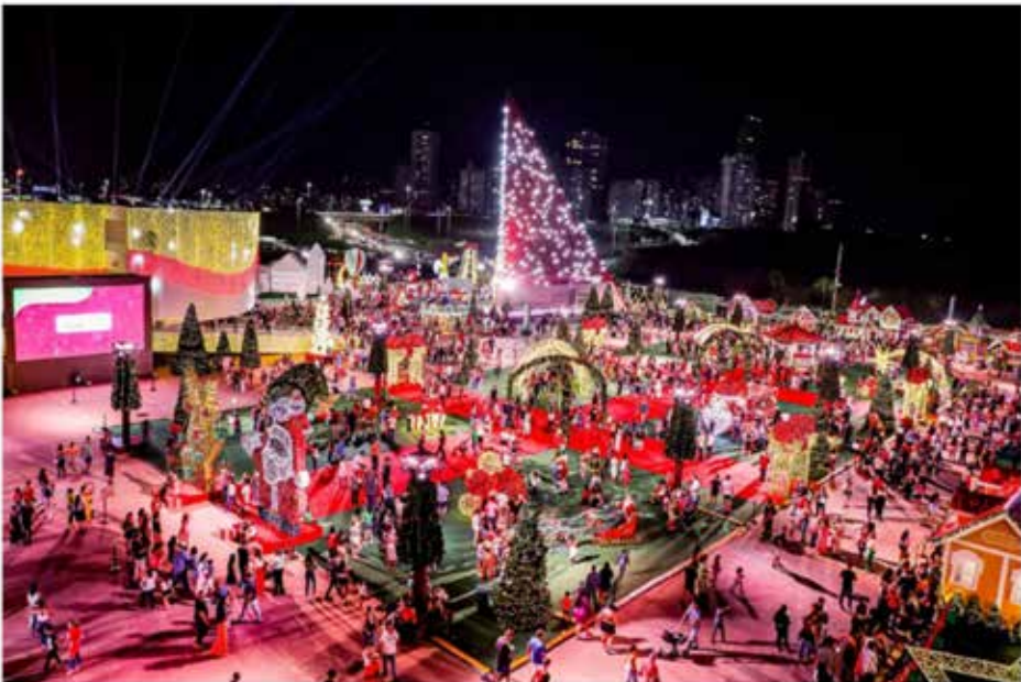
Natal do Bem chega à marca de meio milhão de visitantes em 2023