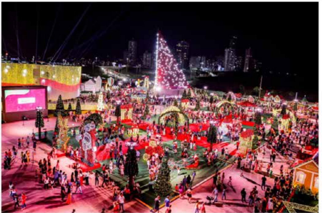
Mais de 500 mil pessoas já visitaram o Natal do Bem em 2023

Evento promovido pelo Goiás Social é considerado o maior do país com entrada gratuita e espera atingir 1 milhão de pessoas ao longo das festividades natalinas - Cultura