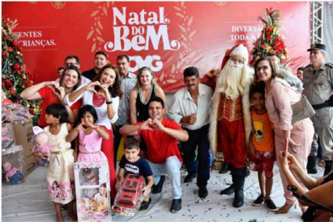
Natal do Bem distribui brinquedos em Goiânia.