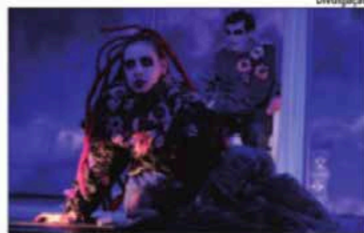
Espectáculo 'Distrito Zero' traz uma celebração de arte e cultura para o Teatro Sesc Centro

O Natal do Bem da Organização das Voluntárias de Goiás (OVG), no Centro Cultural Oscar Niemeyer, é considerado a segunda maior celebração natalina do país, a festa vai até o dia 6 de janeiro de 2024. Ao todo, são mais de 400 apresentações