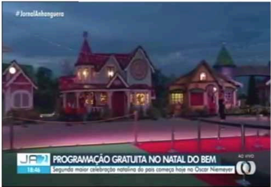
Natal do Bem: decoração no Centro Cultural Oscar Niemeyer será inaugurada nesta quinta