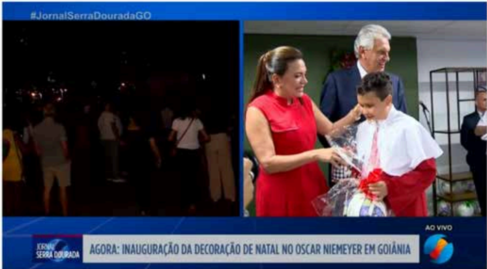
Inauguração da decoração de natal no Oscar Niemeyer