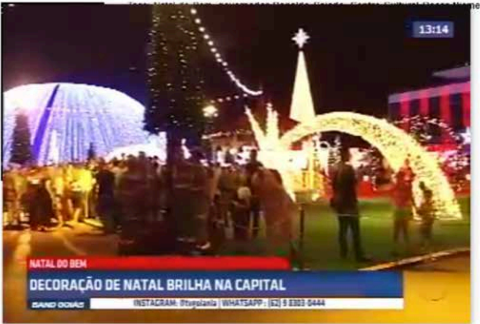
Natal do Bem tem árvore de 40 metros e 2 milhões de pontos de luz

A parâmetro da Goiás Social levamos mais a Luziânia e Valparaíso de Goiás para que as famílias em situação de vulnerabilidade social possam ter acesso a alimentos e produtos básicos.