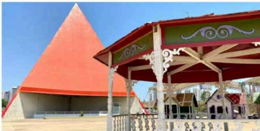
Natal do bem contará com mais de 400 apresentações culturais no Oscar Niemeyer

O evento será gratuito e o público acompanhará a chegada do Papai Noel