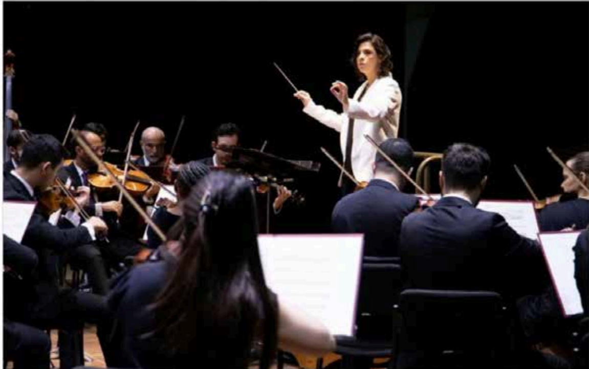
Orquestra Filarmônica de Goiás apresenta concerto interativo no Natal do Bem

Nesta sexta-feira (17), às 20h, a Orquestra Filarmônica de Goiás, realiza um Concerto interativo no Natal do bem