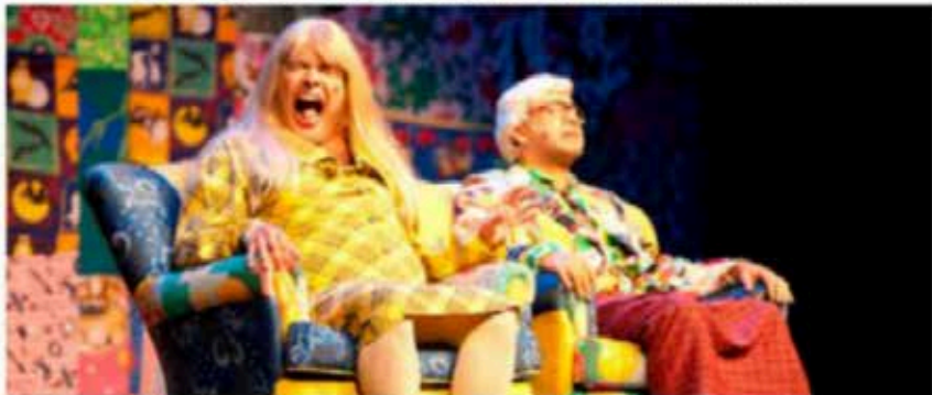
Tormentas da Paixão - A História de Rebecca Sinclair - Cia Os Melhores do Mundo

A Cia Os Melhores do Mundo se apresenta dia 18 de novembro, no Centro de Convenções de Anápolis, e no dia 19 no Teatro Rio Vermelho