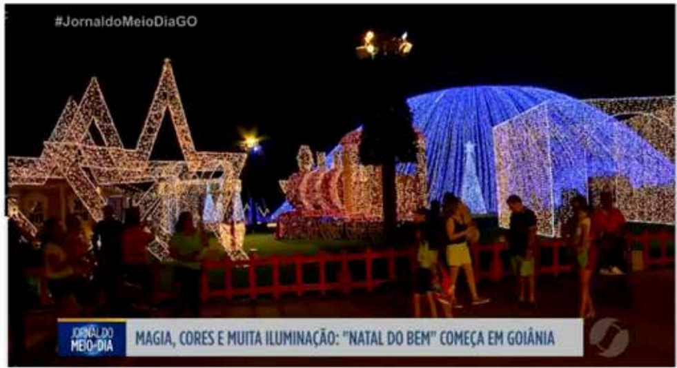
Natal do Bem oferece de graça mais de 400 apresentações em Goiânia