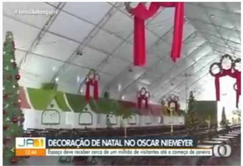
Acontece hoje a inauguração da decoração de natal do Natal do Bem