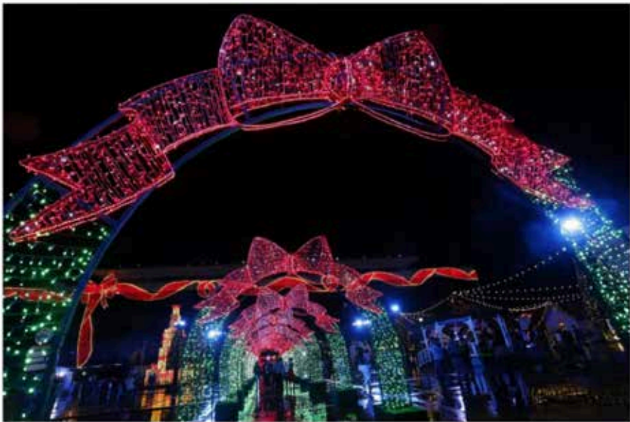
Natal do Bem 2023 será inaugurado hoje (16) no Centro Cultural Oscar Niemeyer

Público poderá acompanhar a chegada do Papai Noel e assistir a Cantata de Natal