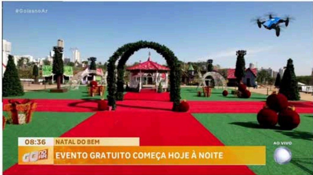
Acontece hoje a inauguração do Natal do Bem