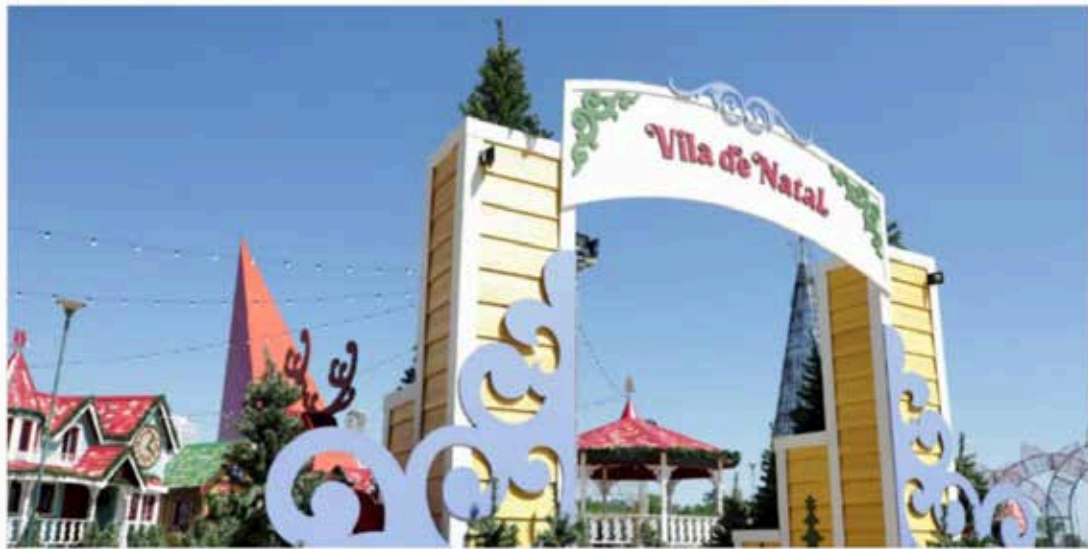
Inauguração do Natal do Bem será hoje (16)