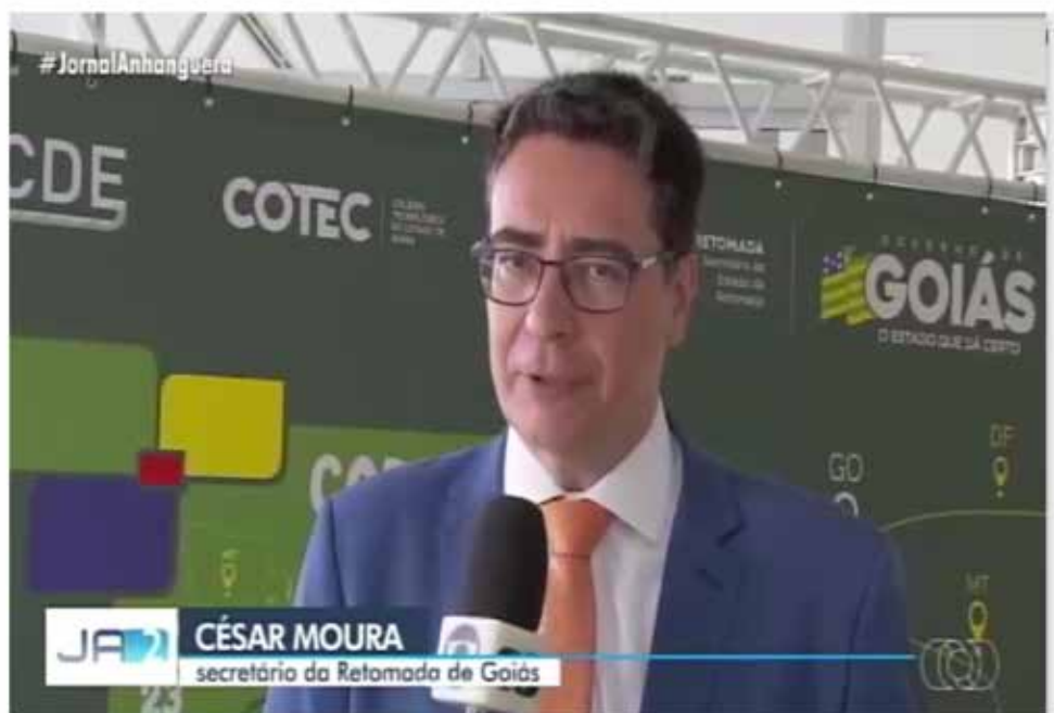
Últimos dias para empresários e agropecuaristas procurarem o FCO