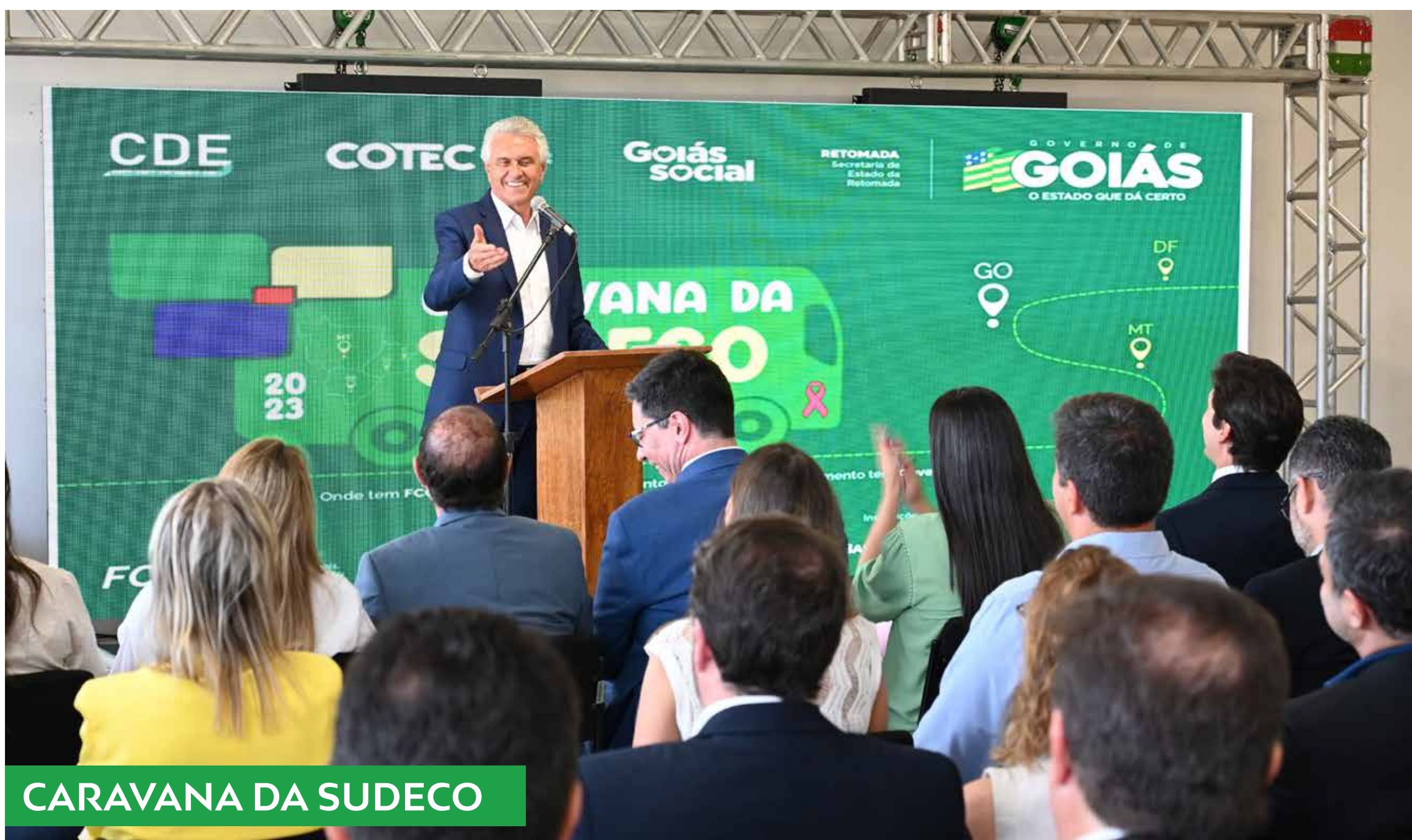
CARAVANA DA SUDECO