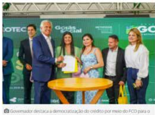
Governador destaca a democratização do crédito por meio do FCO para o desenvolvimento econômico goiano, durante abertura da Caravana da Sudeco

O governador Ronaldo Caiado destacou a importância do Fundo Constitucional de Financiamento do Centro Oeste (FCO) para o desenvolvimento econômico de Goiás, ao participar da abertura da Caravana da Sudeco, nesta segunda-feira (30/10), em Goiânia. O evento tem como principal objetivo facilitar o acesso ao crédito a pequenos e médios empresários, ampliando a geração de emprego e renda. "Não tem como não reconhecer o que o FCO representa para o Centro-Oeste. São milhares de empresas que tiveram esse recurso em Goiás e que puderam alavancar cada vez mais", afirmou Caiado.