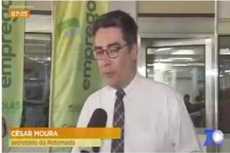
Feirão de empregos oferece 10 mil vagas de trabalho na Praça Cívica

Referência nacional em economia popular, o ex-vendedor de água Rick Chester vai falar ao público do Feirão de Empregos do Goiás Social nesta terça-feira (17/10), na Praça Cívica. A palestra gratuita faz parte das ações com foco em estimular o empreendedorismo entre os participantes do evento. Realizado pelo Governo de Goiás, além da intermediação de mão de obra com mais de 10 mil vagas de emprego e mais de 70 empresas entrevistando candidatos no local, o feirão ainda oferece mais de 15 cursos profissionalizantes totalmente de graça. A programação de palestras conta ainda com outros especialistas em negócios e setor financeiro.