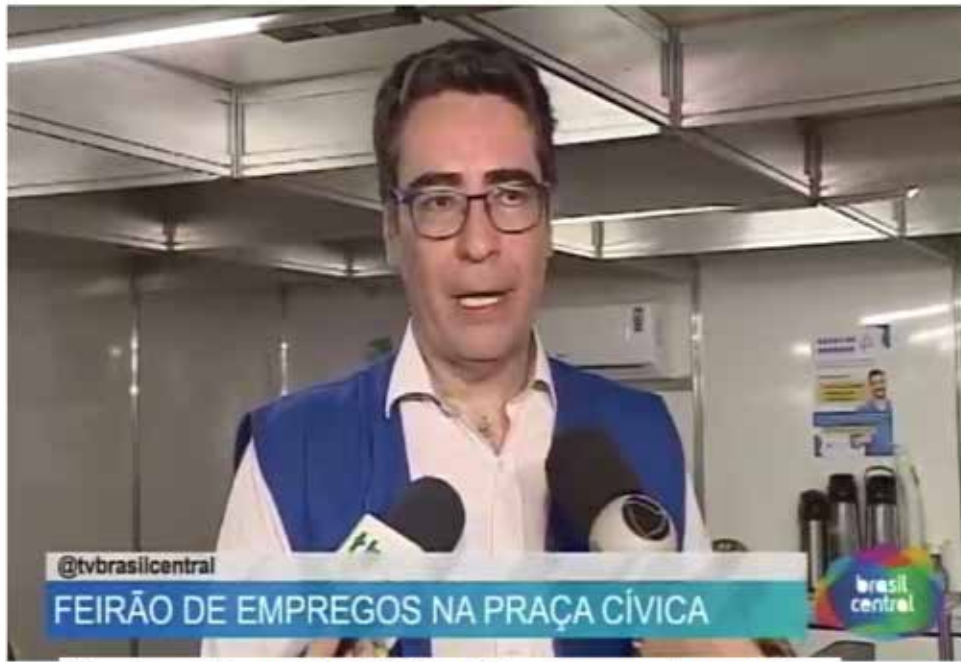
Acontece até amanhã o Feirão de Empregos na Praça Cívica

O governador de Goiás, Ronaldo Caiado (UB), esteve presente nesta quarta-feira (18/10), na edição especial do Feirão de Empregos, realizado durante esta semana em Goiânia, na Praça Cívica, por meio do Goiás Social. Evento estrategicamente pensado como forma de integrar as políticas sociais de distribuição de renda e o estímulo ao emprego como forma de emancipação. Durante a visita, Caiado comemorou o balanço preliminar de atendimento, que inclui 1,3 mil encaminhamentos para entrevistas e 380 contratações fechadas.