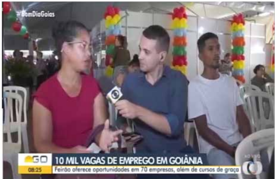
Feirão de Empregos na Praça Cívica oferece mais de 10 mil vagas a partir desta segunda-feira