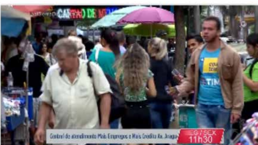
Secretaria da Retomada está com 100 oportunidades para porteiro