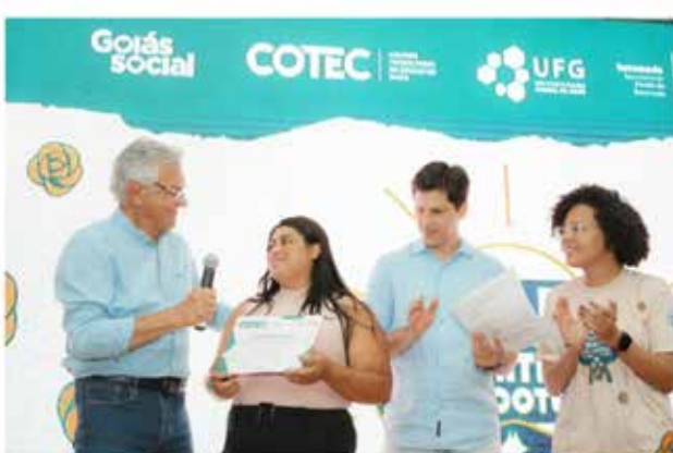
Em comemoração aos 296 anos de Pirenópolis, o governador Ronaldo Caiado esteve no município no sábado (07/10) para participar das celebrações, autorizar adequações no Teatro Pompeu de Pina, além de realizar entregas de benefícios sociais e lançar cursos profissionalizantes. "Queremos trazer cada vez mais benefícios a todos os municípios goianos, com o apoio das prefeituras. Como governador, não comemos só os cartões, o que comemos é tirar as pessoas das condições de desigualdade, é dar oportunidades reais", frisou Caiado.