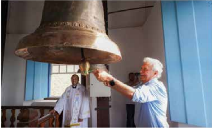
Em visita a Pirenópolis para entrega de dois novos sinos à Igreja Matriz de Nossa Senhora do Rosário, na tarde deste sábado (7), o governador Ronaldo Caiado (UB), anunciou que o tradicional Cavalhódromo será reestruturado. Os sinos receberam investimento de R$ 89 mil do Tesouro Estadual.