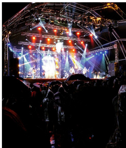
Estrutura realizada pela Futura Comunicação.