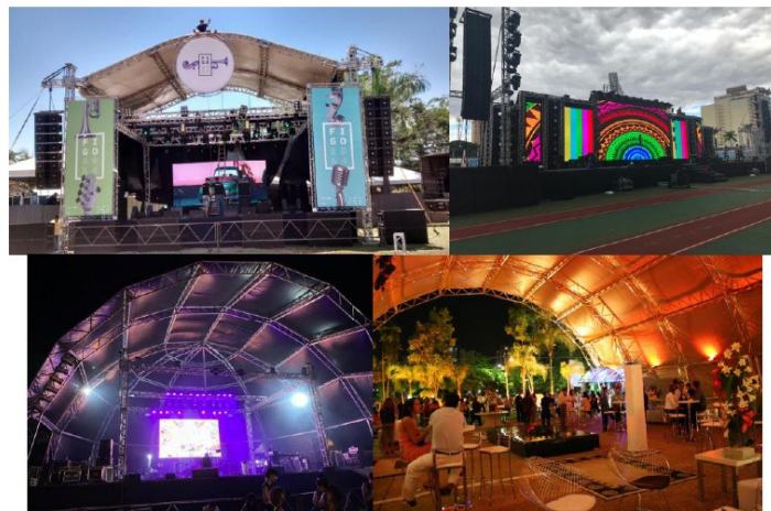
Eventos como Carnaval de Goias de 2023; Convecção do PI; Shows.

Abaixo algumas comprovações de seus serviços: