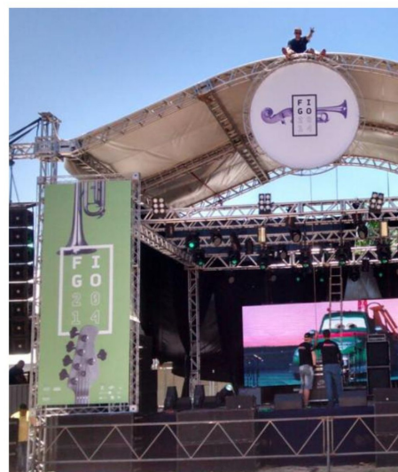
Estrutura realizada pela Futura Comunicação.