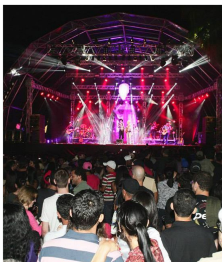
Evento realizado pela Futura Comunicação. Show Sérgio Reis.