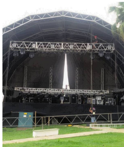
Evento realizado pela Futura Comunicação. Canto da Primavera 2014.