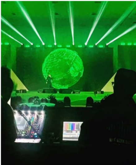
Evento realizado pela StudioK. Workshop de Vendas UNIMED.