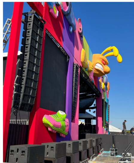
Evento realizado pela StudioK, Inter UFG 2022.