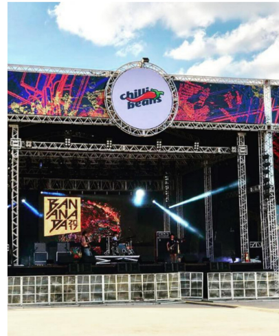
Evento realizado pela StudioK, Chilli Beans #Banánada 2017