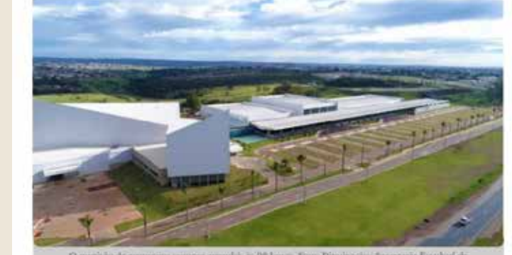
O mundo de empregos começa amanhã. As 08 horas.

Evento acontece nesta quarta (7) e quinta-feira (8), no Centro de Convenções