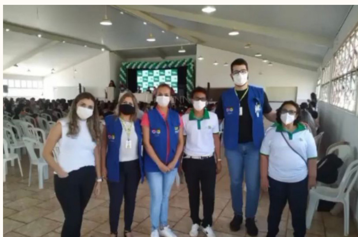
Pires do Rio