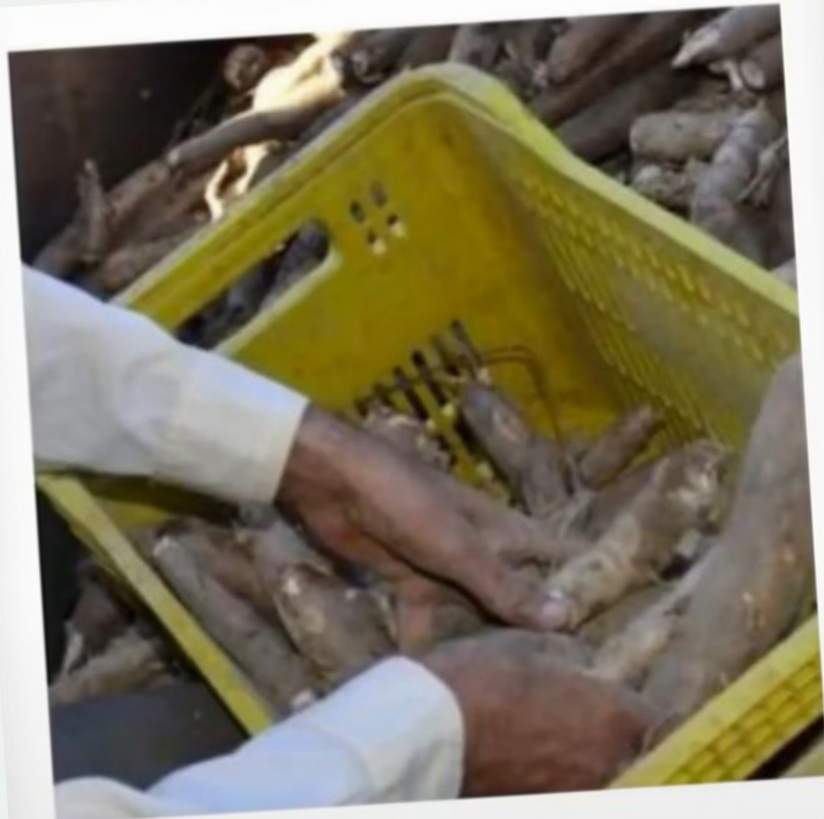
Retrospectiva Projeto da Cerveja de Mandioca