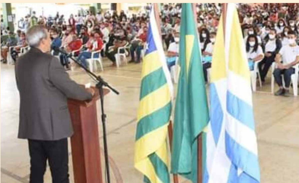
Campos Lindos (Cristalina)