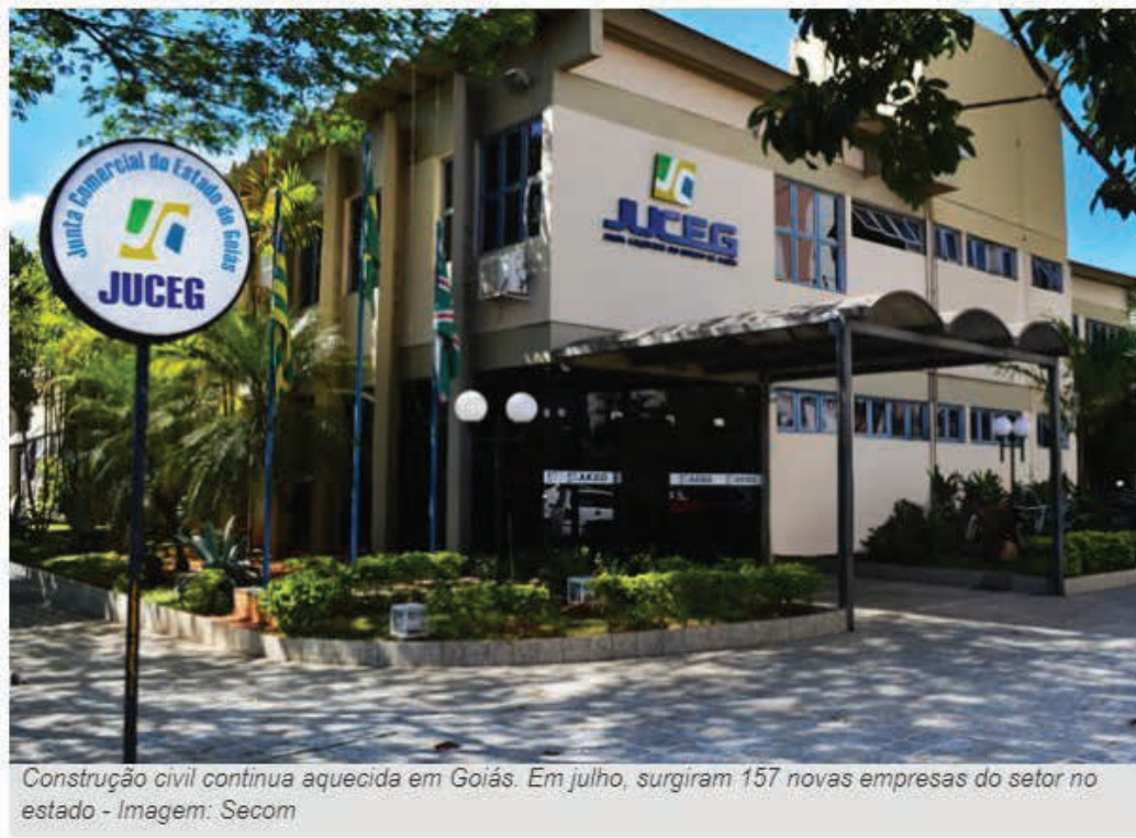
Construção civil continua aquecida em Goiás. Em julho, surgiram 157 novas empresas do setor no estado

Números do mês de julho mostram registro de mais de 2,5 mil novos CNPJ's no Estado. Para abrir uma empresa em Goiás, o empresário gasta em média 20 horas e 22 minutos