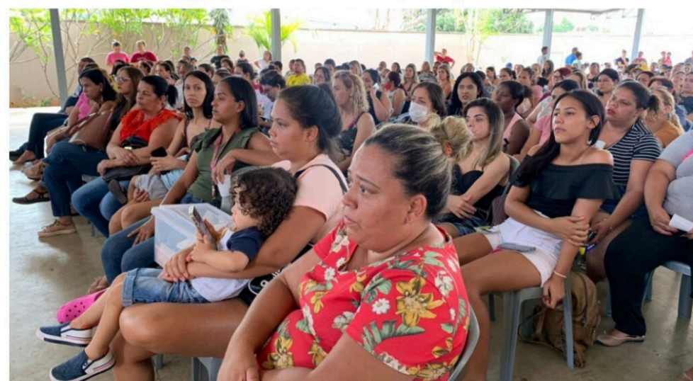
As beneficiadas são concluintes dos cursos gratuitos do Colégio Tecnológico (Cotec), como o de confeitaria, maquiadora, massagista, rotinas administrativas, e serviços de beleza

As beneficiadas são concluintes dos cursos gratuitos do Colégio Tecnológico (Cotec), como o de confeitaria, maquiadora, massagista, rotinas administrativas, e serviços de beleza