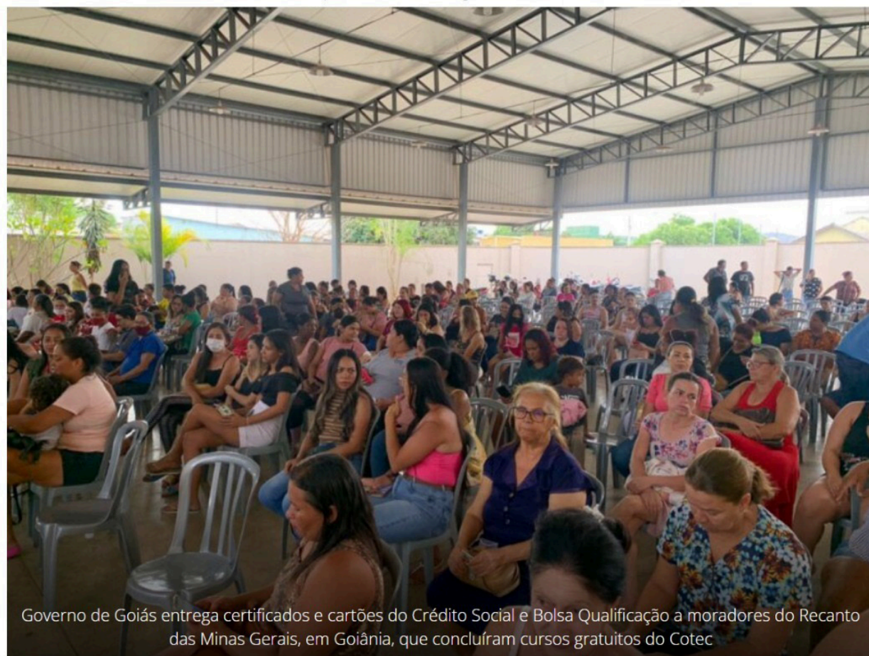
Governo de Goiás entrega certificados e cartões do Crédito Social e Bolsa Qualificação a moradores do Recanto das Minas Gerais, em Goiânia, que concluíram cursos gratuitos do Cotec

Governo de Goiás entrega certificados e cartões do Crédito Social e Bolsa Qualificação a moradores do Recanto das Minas Gerais, em Goiânia, que concluíram cursos gratuitos do Cotec.