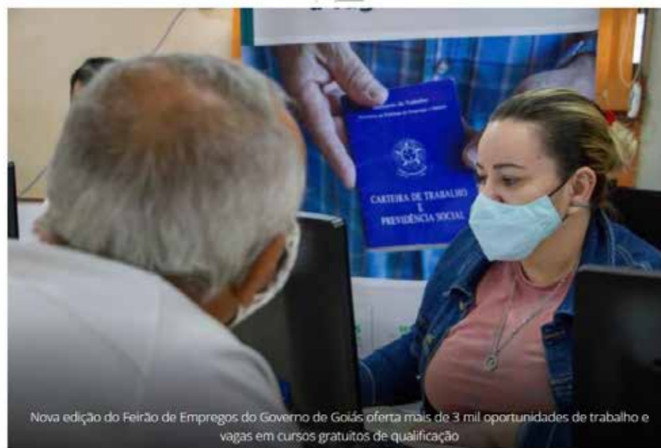
Nova edição do Feirão de Empregos do Governo de Goiás oferta mais de 3 mil oportunidades de trabalho e vagas em cursos gratuitos de qualificação

Além das oportunidades de trabalho, o evento vai oferecer cursos de capacitação profissional e linhas de crédito para micro e pequenos empresários, sem juro e sem necessidade de avalista