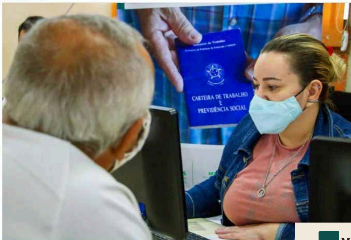
Feirão de Empregos

Evento também oferta cursos gratuitos de qualificação e capacitação, além de linhas de crédito a micro e pequenos empresários. Veja os detalhes