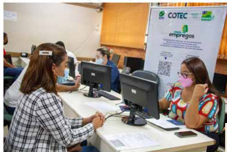
Além das oportunidades de trabalho, o evento vai oferecer cursos de capacitação profissional e linhas de crédito para micro e pequenos empresários.

Além das oportunidades de trabalho, o evento vai oferecer cursos de capacitação profissional e linhas de crédito para micro e pequenos empresários