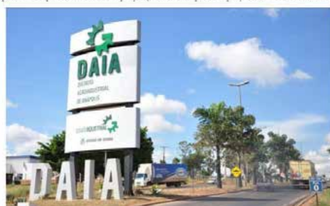
Daia, em Anápolis, um dos setores geradores de emprego.

Apesar de queda da desocupação, ainda há preocupação com a elevada informalidade