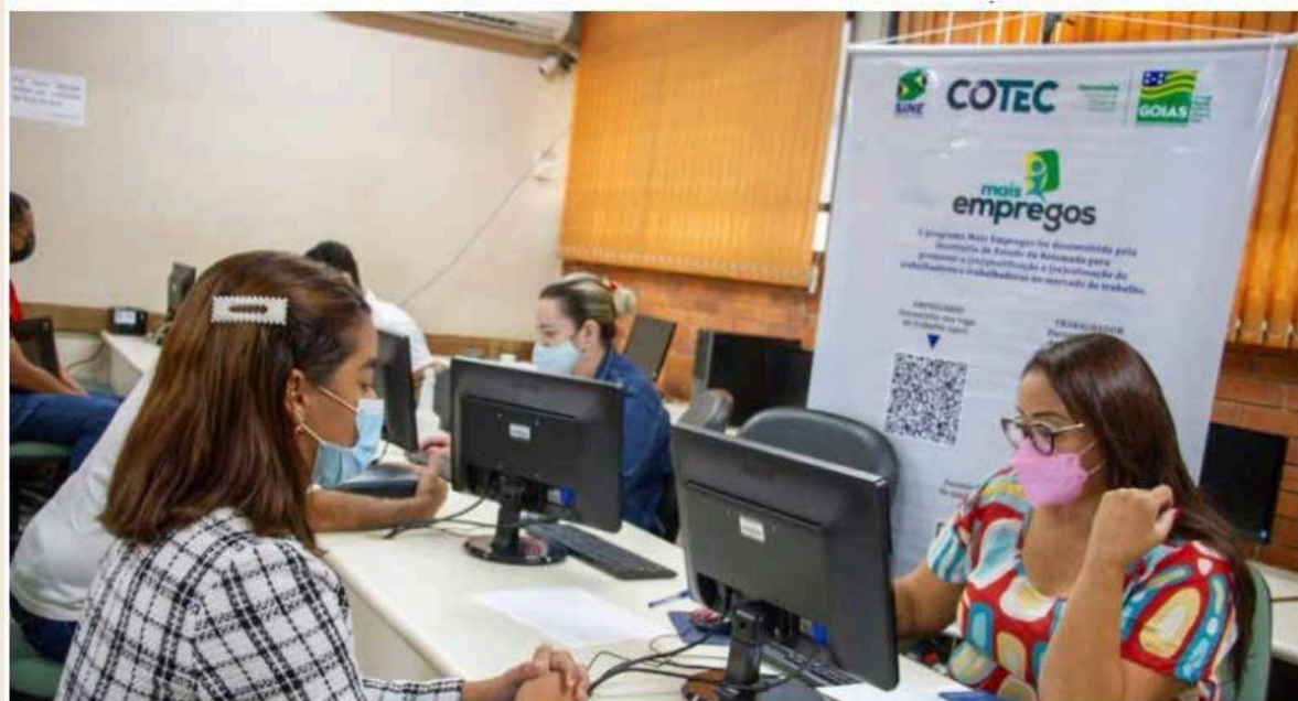
Feirão de Empregos

O Feirão de Empregos irá ofertar, nos dias 24 e 25 de agosto, mais de 3 mil oportunidades de trabalho formal na capital e Região Metropolitana. O evento corre no Colégio Tecnológico Sebastião de Siqueira (Cotec), em Goiânia.