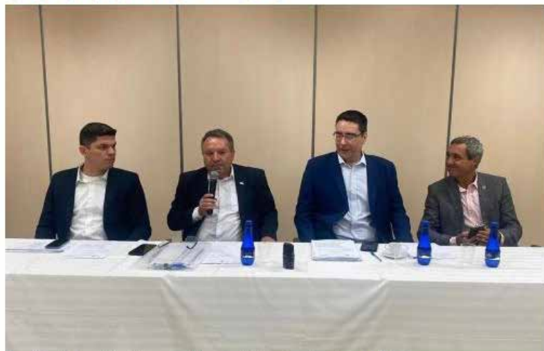
Reunião do Conselho de Desenvolvimento do Estado realizada na OCB/GO

As cooperativas de crédito deram um significativo salto nas operações financeiras dos fundos constitucionais. Segundo o superintendente de Desenvolvimento do Centro-Oeste (Sudeco), Nelson Fraga, nos últimos dois anos o montante das operações saltou de aproximadamente R$ 200 milhões para R$ 1,2 bilhão, atualmente. A informação foi revelada na 381ª Reunião Ordinária do Conselho de Desenvolvimento do Estado, realizada nesta quarta-feira (17/8) na sede do Sistema OCB/GO em Goiânia.