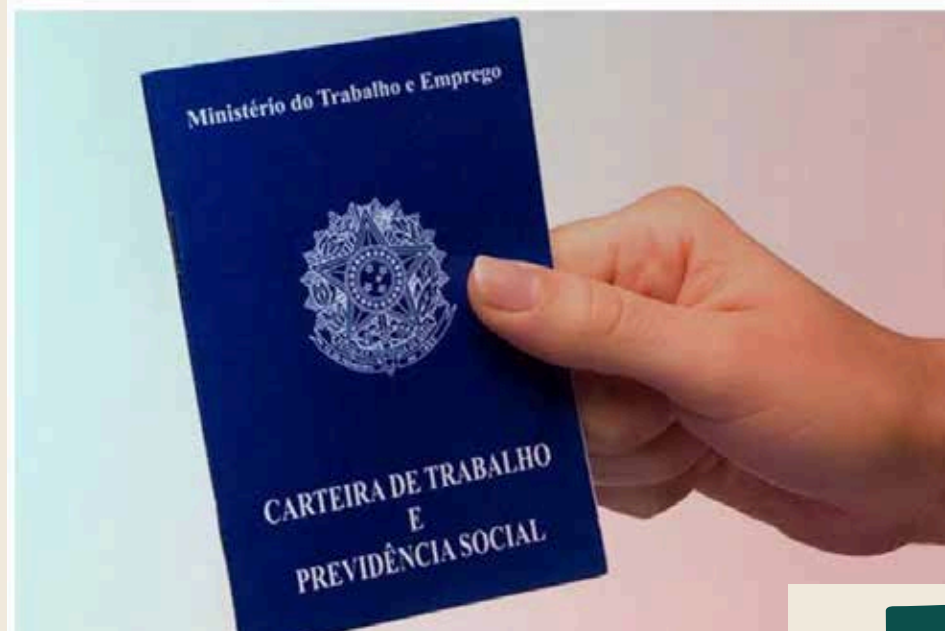
Taxa de desemprego em Goiás é uma das menores desde 2014

Dados divulgados pelo IBGE apontam taxa de desocupação de 6,8% em Goiás, enquanto índice nacional é de 9,3%