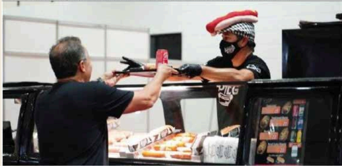
Goiás chegou a 66,7 mil empresas no setor de comércio em 2020. Estado surpreendeu com a retomada.

Dados do IBGE divulgados ontem mostram que o comércio em Goiás cresceu 1,4% em 2020