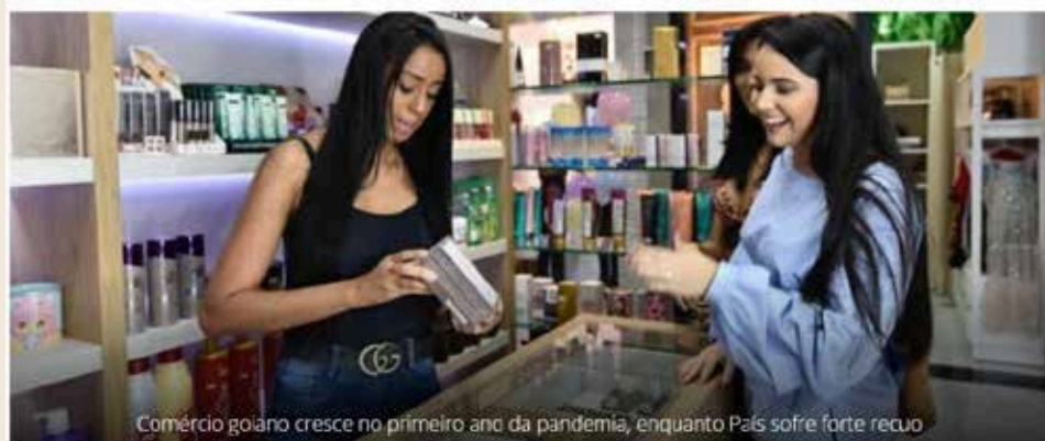
Comércio goiano cresce no primeiro ano da pandemia, enquanto País sofre forte recuo

Dados do IBGE divulgados nesta quarta-feira (17/08) mostram que o comércio em Goiás cresceu 1,4% em 2020, alcançando o 8º lugar entre os estados brasileiros. No País, o setor perdeu em média 7,4% das empresas