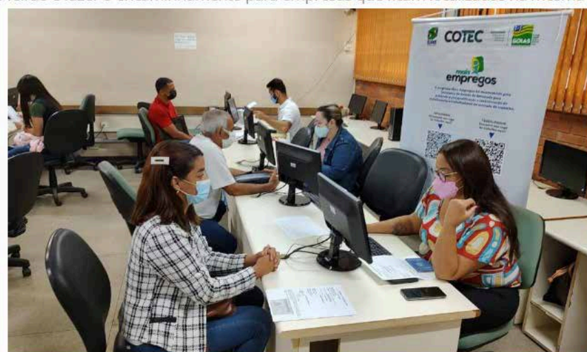
O evento será realizado nos dias 24 e 25 de agosto, das 8h às 18h, no Colégio Tecnológico Sebastião de Siqueira, em Goiânia.

A proposta do feirão é fazer o encaminhamento para empresas que ficam localizadas na mesma região de moradia do interessado