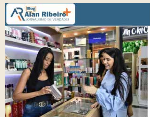
ECONOMIA - GOIÁS