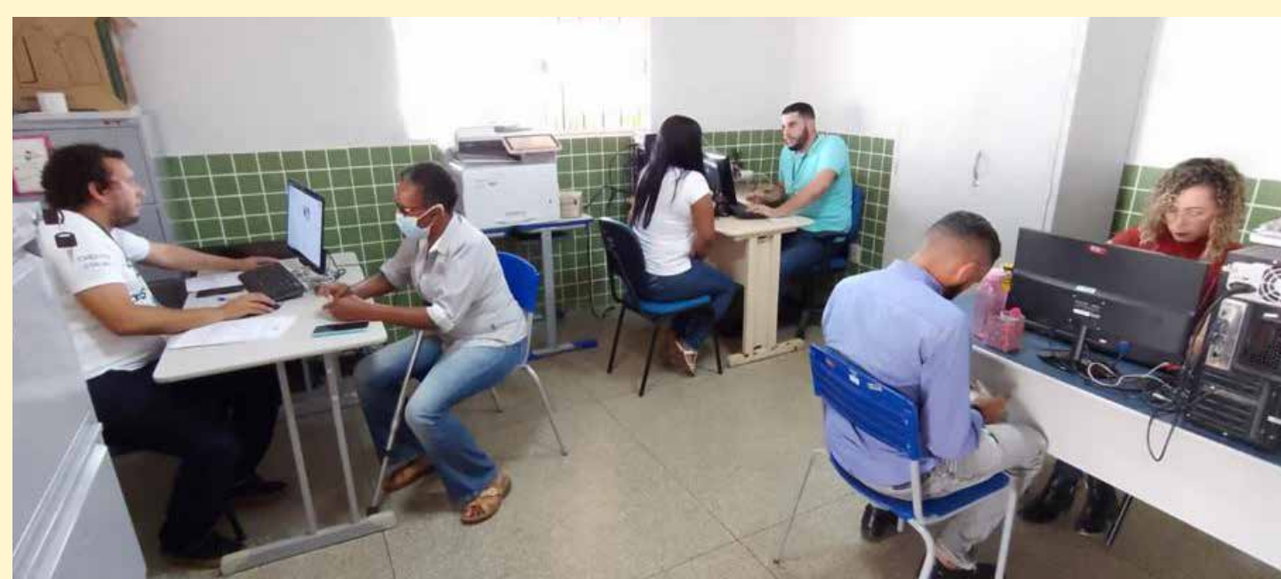
ÁGUAS LINDAS DE GOIÁS