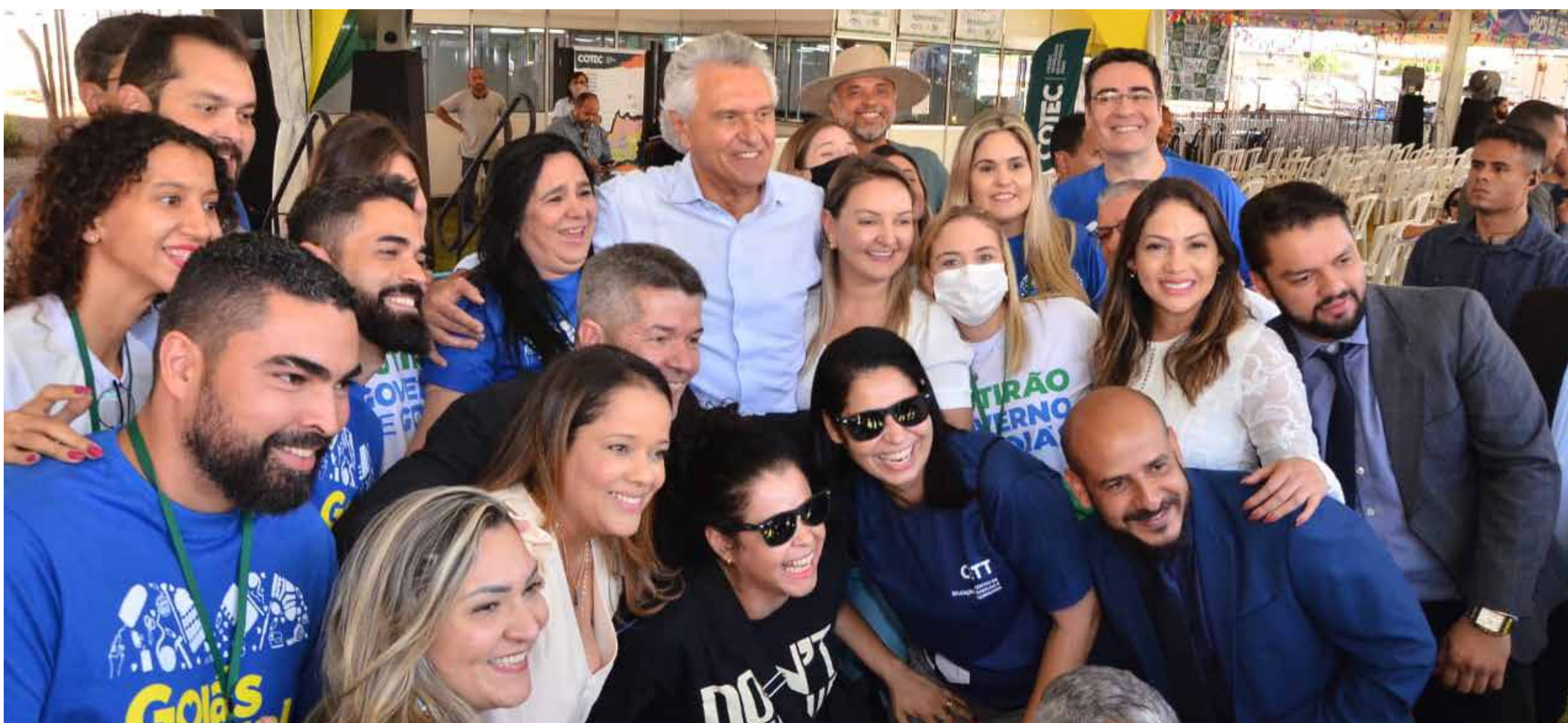
Governador Ronaldo Caiado e equipe da Retomada durante vistoria da montagem do Mutirão em Formosa, na sexta-feira (17/6)